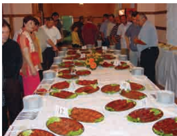
▼ Slika 3. Sa završne svečanosti Večernjakove kulenijade 2004. u Požegi

PROJECT-TRADE d.o.o. PROIZVODNJA – OFFERMANJE – VELEPRODAJA – MALOPRODAJA – PROJEKTIranJE – MONTAŽA – SERVIS