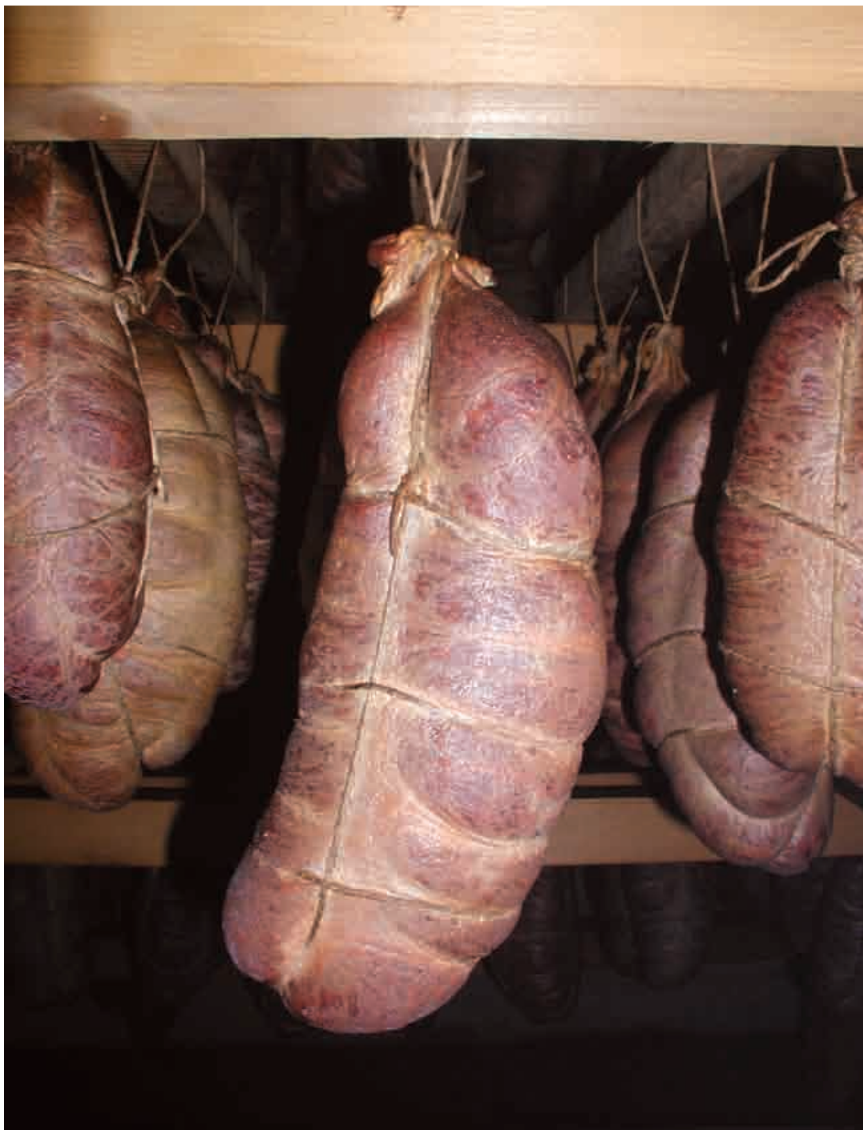
▼ Slika 1. Kulen - ponos slavonskog domaćinstva