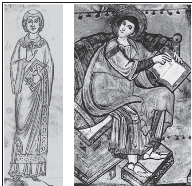
Sl. 4 Ikonografski dokazi uporabe kopči na uvezima knjiga. Lijevo: Marcus Tullius Cicero, Djela, sredina 12. st.; desno: Evanđeljarij Abbeville Saint Riquier, oko 800. godine (prema Schiefferu 1999. i Haas-Gebhardu 2006)