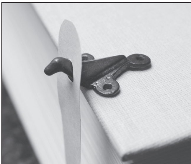
Sl. 3 Nitra-Šindolka. Rekonstrukcija uporabe okova korica knjige Abb. 3 Nitra-Šindolka. Rekonstruktion der Benutzung des Beschlags von dem Bucheinband

ne postoje kombinacije predmeta tipičnih za ranu fazu I. stupnja bjelobrdske kulture te, osim nekoliko iznimaka, nisu pronađeni ni grobovi s nalazima iz II. stupnja bjelobrdske kulture, prijeko je potrebno datirati grob E299 u mlađu fazu I. stupnja bjelobrdske kulture. Prema apsolutnoj dataciji konvencionalne kronologije grobalja bjelobrdskog tipa, koja je izložena u više radova svečara Ž. Tomičića (npr., 1991, T. VII; 1993; 1993a, T. 19; 1994-1995, sl. 16; 1998-1999, T. 3; 2000, T. 3), riječ je o razdoblju između 995. i 1030. godine. Ovakva točna datacija mora se uzeti uz određenu fleksibilnost, u našem slučaju možda više prema 10. st.