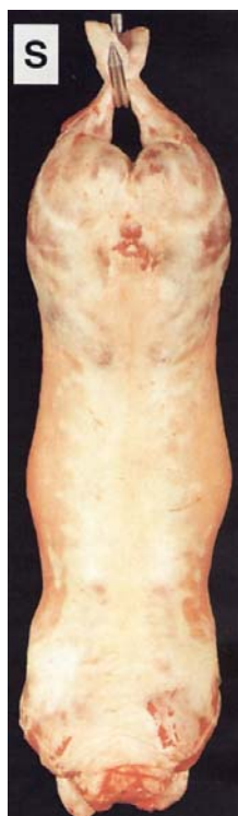
Slika 3. – JANJEĆI TRUP „S“ KLASE Fig. 3. – CARCASS CONFORMATION SCORE “P”