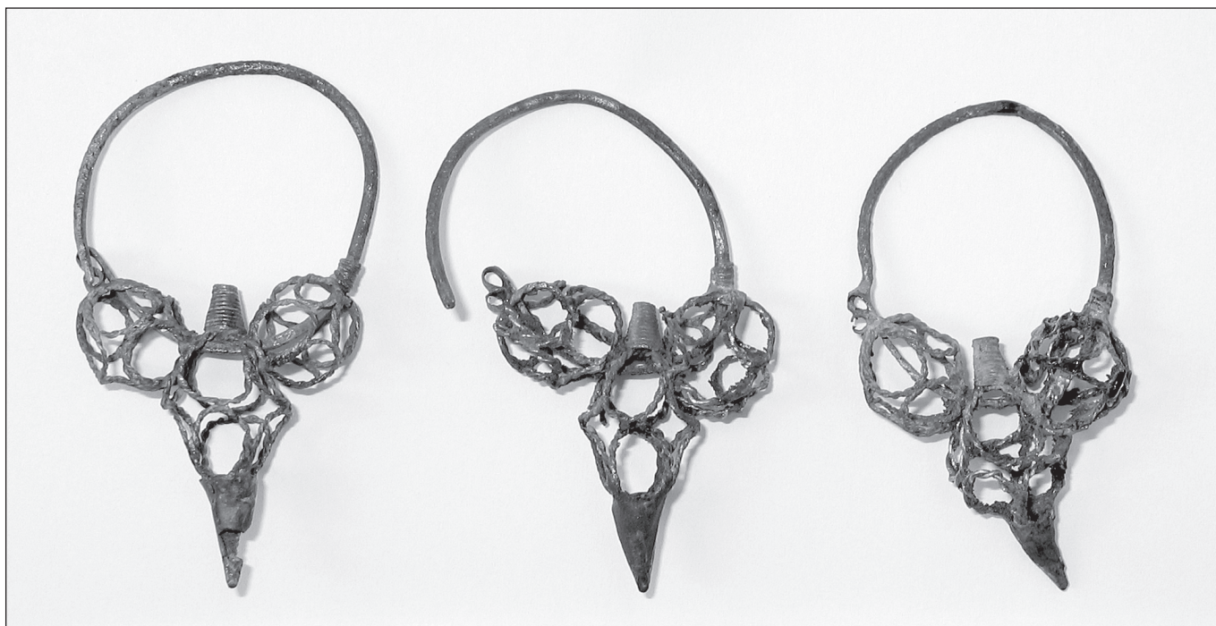
Sl. 5 Trojagodne sljepoočničarke, grob 108 - Lobor, Majka Božja Gorska. Fig. 5 Three-bead hair-loops, grave 108 - Lobor, mMajka Božja Gorska.

u grobu 96 nađeno je sedam istih i tri nešto drugačije trojagodne sljepoočnicarke (Simoni 1994: 158-159; Simoni 2002: 144-145). Sve imaju S-petlju. Katica Simoni ih datira na početak 12. st. (Simoni 1994: 158). Sjeverno od rijeke Drave nađene su u ostavi skrivenoj pred Mongolima u Nyáregyháza-Pusztapótharaszt (Parádi 1975: 158, sl. 2, 3). Prema novcima nađenim u toj ostavi koji datiraju iz vremena prije mongolske provale, postavlja se i gornja granica njihova nošenja. Identične su nađene u Nitrianskoj Blatnici, Ruttkay ih datira u 10. i 11. st. (Ruttkay 1979: 96, sl. 16). One u svojoj osnovi odgovaraju bizantskom tipu trojagodnih naušnica, tzv. tokajskom tipu. Možda su te trojagodne sljepoočnicarke i napravljene prema uzoru na luksuzne bizantske naušnice od domaćih obrtnika. Slične se nalaze na moravskom području nakon propasti velikomoravske države. One se obično datiraju u 10. i 11. st. (Ruttkay 1996: Abb. 5). No, između njih je nekoliko stoljeća razlike i teško