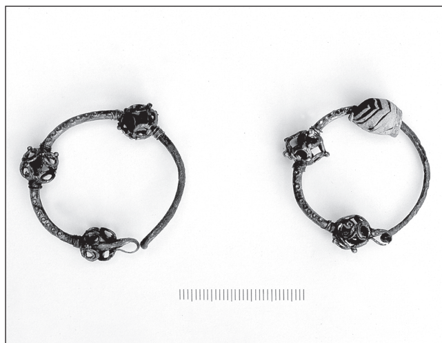
Sl. 4 Par trojagodnih sljepoočničarki, grob 187 - Đakovo, Župna crkva.