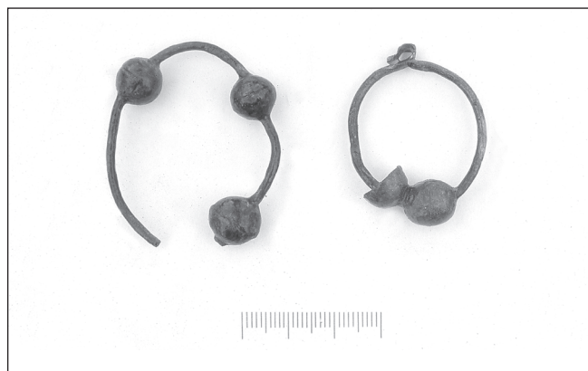
Sl. 2 Par trojagodnih sljepoočničarki, grob 146 - Đakovo, Župna crkva. Fig. 2 A pair of the three-bead hair-loops, grave 146 - Đakovo, the Parish Church.