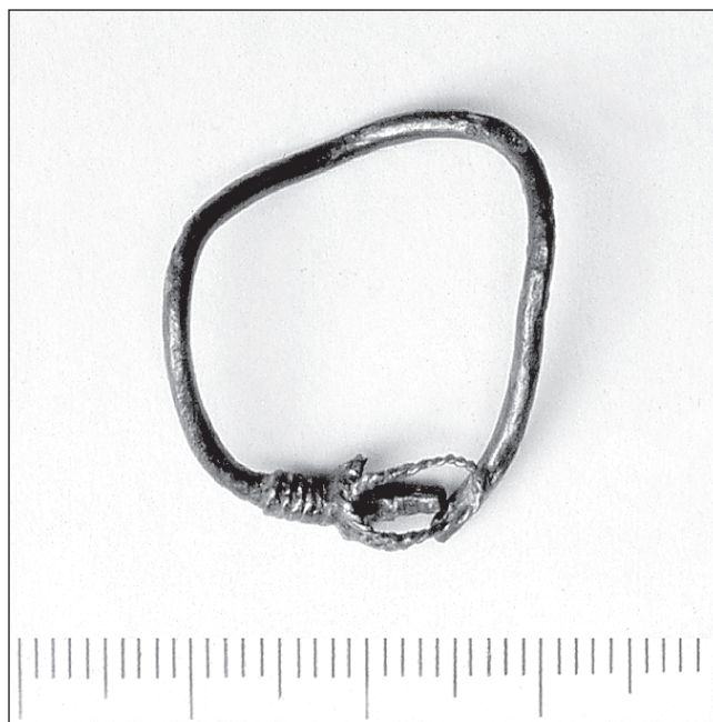
Sl. 1 Fragmentarno sačuvana trojagodna sljepoočničarka, grob 50 - Đakovo, Župna crkva.

Fig. 1 Fragments of a three-bead hair-loop, grave 50 - Đakovo, the Parish Church.