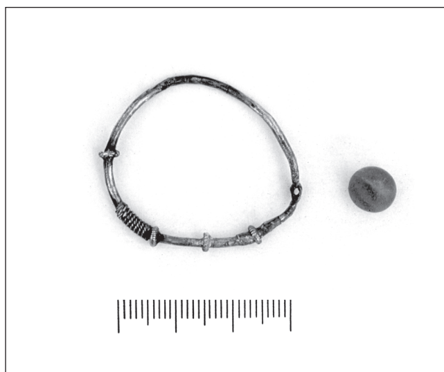
Sl. 3 Fragmentarno sačuvana trojagodna sljepoočničarka, grob 136 - Đakovo, Župna crkva. Fig. 3 Fragments of a three-bead hair-loop, grave 136 - Đakovo, the Parish Church.