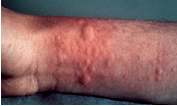
Slika 1. Kontaktna urtikarija na lateksu (White G. Color Atlas of Dermatology. Edinburgh: Mosby; 2004)