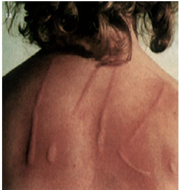
Slika 3. Dermografizam - crveni (White G. Color Atlas of Dermatology. Edinburgh: Mosby; 2004)

Kod fizikalne urtikarije pozitivan je dermografizam (slika 3) u testu opterećenja pritiskom – test opterećenja pritiskom (0,2 do 0,4 kg/cm 2 10-20 minuta); provokacijski test kod urtikarije na hladnoću (hladna voda, led te krioglobulini u serumu); za urtikariju na toplinu izvodi se test opterećenja toplinom (topla kupka 42 °C), kod solarne urtikarije – izlaganje UV zrakama ili vidljivom svjetlu različitih valnih duljina od 285 do 760 nm, kod urtikarijskog vaskulitisa (slika 4) izvodi se biopsija kože (5, 8).