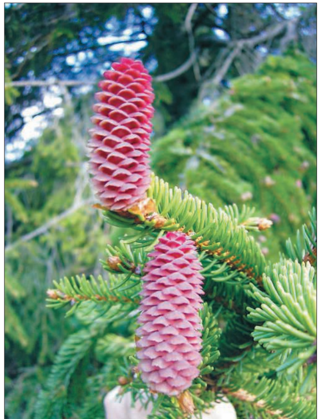
Slika 2. Ženski cvijet kod smreke Picture 2 Norway spruce female flowers

Kao i u mnogim europskim zemljama, zdravstveno se stanje smrekovih šuma Bosne i Hercegovine u zadnje vrijeme pogoršava. Razloge treba tražiti u neodgovarajućem gospodarenju, ali i u jakim klimatskim promjenama u zadnja dva desetljeća. Ponajprije tu su dugotrajne suše, praćene ekstremno visokim temperaturama, što je značajno narušilo stabilnost smrekovih šuma (Dautbašić, 1997). To se to jako odrazilo na umjetne nasade koje su podignute izvan optimalnih ekoloških uvjeta za smreku. Posebno je interesantno da smreka u odnosu na bukvu i običnu jelu ima smanjenu sposobnost prirodne obnove u mješovitim šumama, a to dovodi do toga da u šumama često prevlada agresivnija bukva, a ponekad i obična jela.