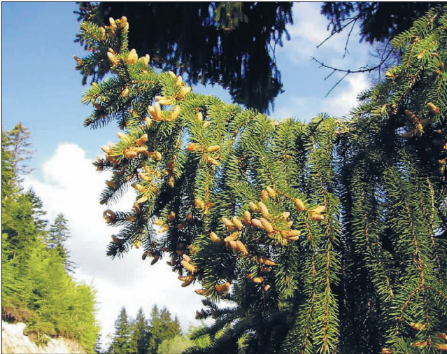
Slika 1. Muški cvjetovi kod smreke Picture 1 Norway spruce male flowers

U Bosni i Hercegovini obična smreka raste na površini od oko 585 000 ha ili u oko 21 % svih šuma (Matić i sur. 1970), u različitim biljnim zajednicama, ponajprije mješovitim s običnom jelom i bukvom. Ovi podaci ukazuju na to koliko je smreka važna za proizvodno šumarstvo, a i ekologiju, te je po važnosti odmah iza bukve i obične jele.