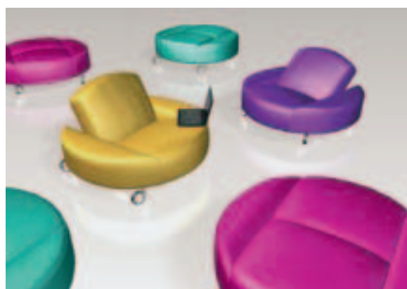
Studio Schrofer, IMM Cologne 2008

Ojastučeni namještaj ima multifunkcionalnu namjenu. Željama potrošača da iskoriste vlastitu kreativnost i varijabilno urede prostore prema svojim potrebama mogu udovoljiti domišljato dizajnirane multifunkcionalne ojastučene površine . Rješenja su često naizgled vrlo jednostavna, a nastala su zbog jasne želje krajnjih potrošača za multi-funkcionalnošću i većom fleksibilnošću. Proizvodi nisu samo mobilni i lako rastavljivi radi funkcionalnog razmještaja, već i prilagođeni upotrebi ovisno o raspoloženju korisnika.