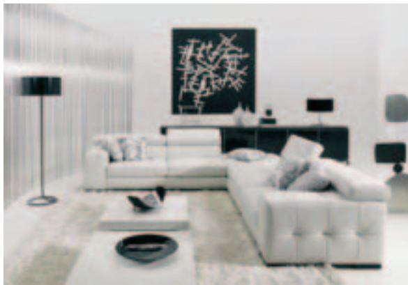
Natuzzi SpA, IMM Cologne 2008.