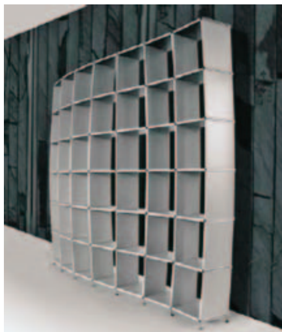
Knell dizajn, IMM Cologne 2008

Namještaj je lagan i fleksibilan. Urbane sredine sa sve većim brojem stanovnika imaju potrebu štednje prostora za stanovanje, pa mali stanovi bez ikakvih karakterističnih prostorija poput kuhinje te dnevne, spa-