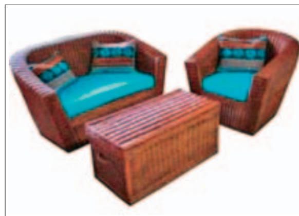
Međimurjeplet, Imm Cologne 2008.

Na ovogodišnjem sajmu Republiku Hrvatsku predstavilo je osam proizvođača: DI Sekulić, d.o.o.; DIN Novoselec, d.o.o.; Lapibus, d.o.o.; Javor, d.o.o.; Inkea, d.o.o.; Međimurjeplet, d.d.; Studio Mosaico i Drvni cluster SZH, na ukupnoj površini od 300 m 2 (paviljon 2.2-moderan namještaj; 4.1-stolice i sjedeće gar-