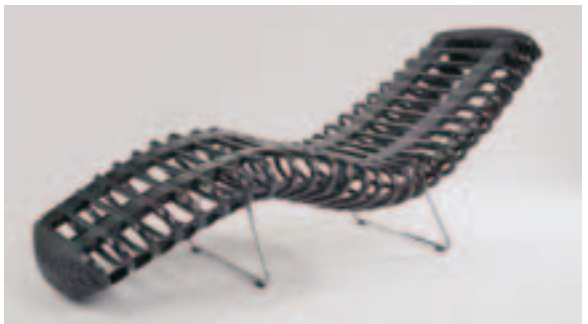
Yos Theosabrata, Imm Cologne 2008.