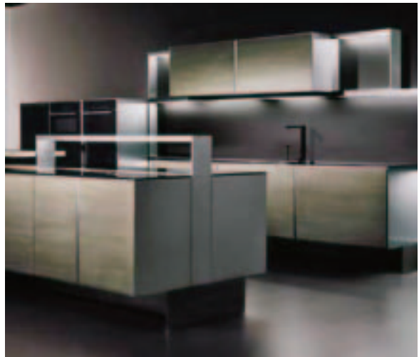
Porsche dizajn, Imm Cologne 2008.

Green Line namještaj. Namještaj proizveden od prirodnog materijala, koji se može reciklirati i na taj način zaštititi okoliš, prvorazredan je ovogodišnji hit.