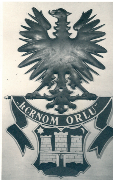
Slika 1. Grb ljekarne (fotografija iz Odsjeka za povijest medicinskih znanosti Zavoda za povijest i filozofiju znanosti, HAZU)

Prvi apotekari navedeni su samo imenom. Uglavnom je riječ o strancima koji su se kraće ili duže vrijeme zadržavali na našem području i ovdje pružali ljekarničke usluge. Naziv za trgovca u to vrijeme u dokumentima varira od "štacunara", "kramara", "stacionarius" do "apothecarius", pa je prema tome ponekad teško točno zaključiti koji je od spomenutih objekata zapravo bio ljekarna. Zanimljiv je podatak iz 1477. u kojem se spominje tadašnja zgrada na uglu Kamenite i današnje Habeličeve (na mjestu današnje zgrade ljekarne). Vlasnik, zlatar Pavao, posjeduje na ovom mjestu "apateku" (9). Još uvijek ne možemo pouzdano odgovoriti na pitanje je li se ovdje radilo o iznajmljivanju prostora nekom ljekarniku ili je to bio zlatarov dućan, tj. zlatarnica.