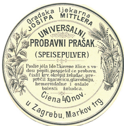
Slika 4. Reklama za Univerzalni probavni prašek u vrijeme vlasništva Josipa Mittlera

smanjenom značenju ljekarne u to doba. To se zacijelo moralo odraziti i na njezinu poslovanju. U Odsjeku za povijest medicinskih znanosti HAZU sačuvano je primjerice originalno pismo Henrika Jaskieviča kojim 1885. nudi gornjogradsku ljekarnu na prodaju (slika 3). Iz razdoblja vlasništva Nijemca Josipa Mittlera sačuvana je dvojezična reklama za Univerzalni probavni prašek , koja nam ujedno otkriva i njezinu lokaciju, još uvijek na Markovu trgu (slika 4).