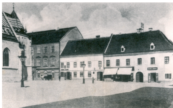
Slika 2. Fotografija ljekarne na Markovu trgu, kraj 19. stoljeća

Sljedeći u nizu vlasnika gradske ljekarne je ljekarnik Čermak koji ju seli na Markov trg (slika 2), u iznajmljeni prostor u prizemlju. Neugledna katnica stiješnjena u nizu kuća, kvalitetom i lokacijom daleko je ispod razine reprezentativne uglovnice u Kamenitoj, što govori o