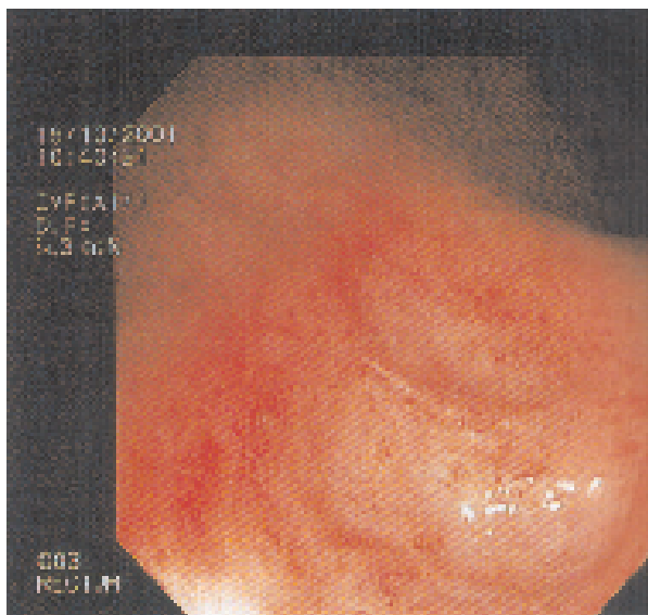
Slika 2. Frijabilna, hiperemična sluznica u ulceroznom kolitisu; rektoskopski nalaz