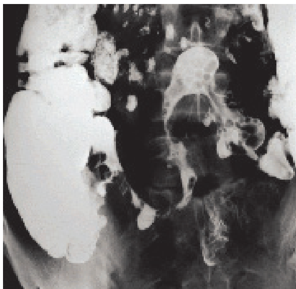
Slika 4. Stenozirajući oblik Crohnove bolesti; pasaža tankog crijeva

Radiološke pretrage. U teškim oblicima bolesti iznimno je važna nativna snimka abdomena kojom se isključuje ili potvrđuje toksični megakolon, ileus ili perforacija crijeva. Irigografija je korisna za procjenu proširenosti bolesti u debelom crijevu i otkrivanje komplikacija poput striktura i karcinoma. Osobito je važna za evaluaciju cijelog debelog crijeva, ako to endoskopski nije moguće zbog suženja crijeva. Za evaluaciju promjena u tankom crijevu primjenjuje se pasaža tankog crijeva (slika 4) ili enterokliza, nezaobilazna pretraga u procjeni anatomske proširenosti i