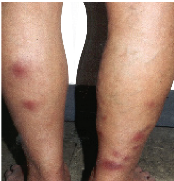
Slika 1. Nodozni eritem

povezane sa stupnjem upalne aktivnosti u debelom crijevu jesu primarni sklerozirajući kolangitis, uveitis, ankilozirajući spondilitis i sakroileitis (9).