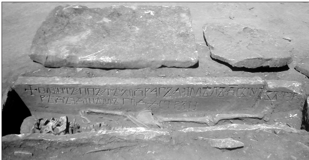
Sl. 2.: Natpis popa Tjehodraga in situ .

Među nalazima s ovoga lokaliteta izdvaja se na dva dijela razlomljena vapnenačna ploča s natpisom na hrvatskoj ćirilici iz groba br. 21., koju ovaj rad i opisuje. 5 Pronađena je tijekom druge istraživačke kampanje, koja je trajala od 1. srpnja do 22. kolovoza 2003. 6 Služila je kao bočna obložna ploča (sl. 2.), u grobu u kojem su jedan