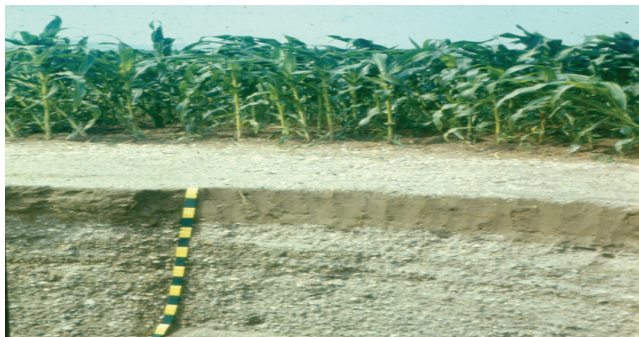
Slika 1. Aluvijalno tlo Figure 1. Calcaric Fluvisol (alluvial)