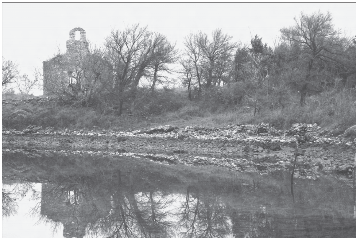
Sl. 1. Zaljev Soline (Krk), 2006. g., položaj lokaliteta u uvali Svetog Petra

Key words: the bay of Soline, lagoon Sv. Petar, Roman period, ceramic fragments