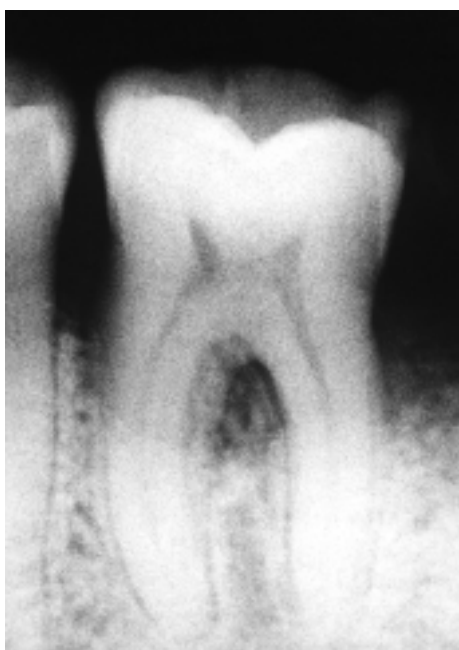
Slika 1a. Prikaz stanja 6 mjeseci nakon kirurškog tretmana Figure 1a. 6-months postoperative condition

Šest mjeseci nakon zahvata napravljena je kontrola kliničkog i radiografskog nalaza. Sondiranjem parodontnog džepa 6 mjeseci nakon zahvata je na mjestu gdje je umetnut usadak vidljiva smanjena dubina džepa od 8 na 4 mm. Dobitak razine parodontnoga pričvrstka bio je 5 mm, a interradikularno sondiranje pokazalo je smanjenje klase II u klasu I. Radiografski je nalaz 6 mjeseci nakon zahvata pokazao da je alveolna kost aproksimalno i interradikularno manje radiolucentna. Ovaj nalaz nas upućuje na stvaranje nove koštane formacije na mjestu defekta (Slika 1a).