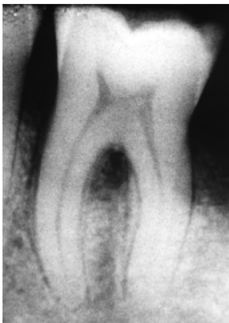
Slika 1. Prikaz interradikularne alveolarne kosti prije tretmana

Pacijentica u dobi od 64 godine javila se je na Zavod za parodontologiju Stomatološkog fakulteta u Zagrebu zbog upalnog procesa parodonta prvog i drugoga donjeg desnog molara. Kliničkim pregledom ustanovljeno je da u tome području postoji parodontni apsces na zubu 47 i 46 te i upalne promjene gingive gotovo svih zuba što je upućivalo na dijagnozu parodontitisa. Svrha tretmana bila je ukloniti upalne simptome te smanjiti dubinu parodontnih džepova. Zub 47 izvađen je zbog duboka intrakoštano defekta. Na zubu 46 postojao je dubok parodontni džep od 8 mm, gubitak parodontnoga pričvrstka 10 mm distalno i lingvalno te oštećenje furkacije stupnja II. Na radiografskoj snimci bila je vidljiva resorpcija alveolne kosti kao i radiolucencija interradikularne alveolne kosti (Slika 1).