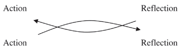
تصویر ۴: دیالکتیک پراکسیس

عنوان یک پراکسیس نیز به صورت پیوند بین تئوری و عمل توصیف می‌شود که بیان‌گر تلفیق فرایندهای عملکرد و تحقیق است یا همان طور که هاجز بیان می‌کند «تلفیق تئوری و عملکرد، تلفیق تحقیق و عملکرد» است (۸). اوبرین می‌گوید «در یک فرایند پیش‌رونده، دانشی که از عملکرد ناشی می‌شود و عملی که به وسیله دانش هدایت می‌شود، نقطه اتکای اقدام‌پژوهی است» (۷ و ۸). ناروئمون می‌نویسد پراکسیس اساساً به یک حرکت عقلانی، عاطفی و عملی اشاره می‌کند. در حقیقت پراکسیس یک دیالکتیک است که به طور اولیه در رویکرد اقدام‌پژوهی مشارکتی (PAR) توسعه یافته است. او این دیالکتیک را به شکل زیر نشان می‌دهد (۱۱).