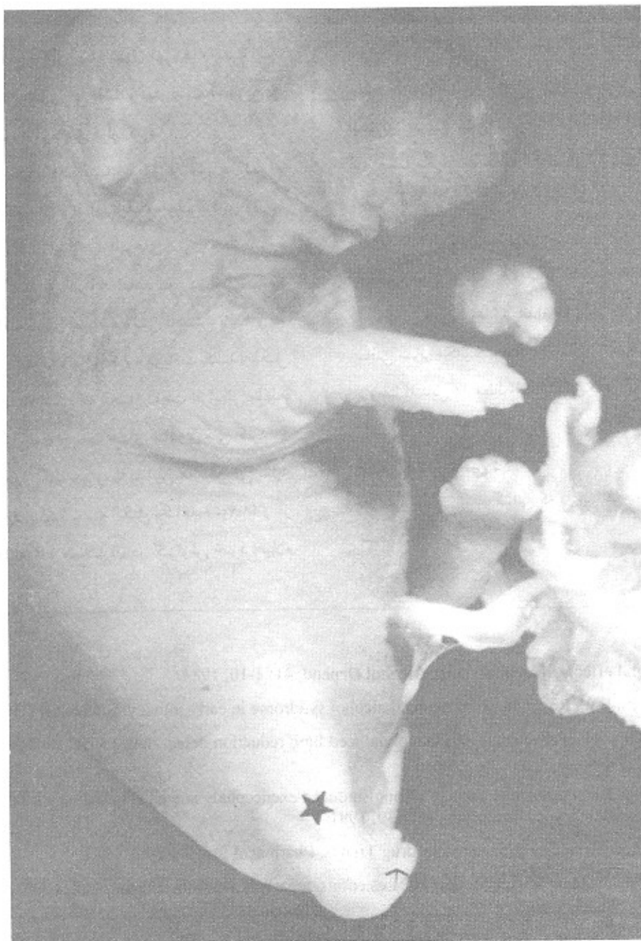
تصویر شماره ۴: دفرمیتی در اندام تحتانی راست در جنین موش حامله دریافت کننده آسپرین و الکل

تفاوتی وجود نداشت هر چند که ناهنجاری از نوع غیر اندامی (۱) به شکل تأثیر بر انحناى ستون مهره ای در گروه آسپرین ملاحظه گردید. با توجه به نتایج فوق می توان آسپرین را یک ریسک فاکتور برای تکامل سایر