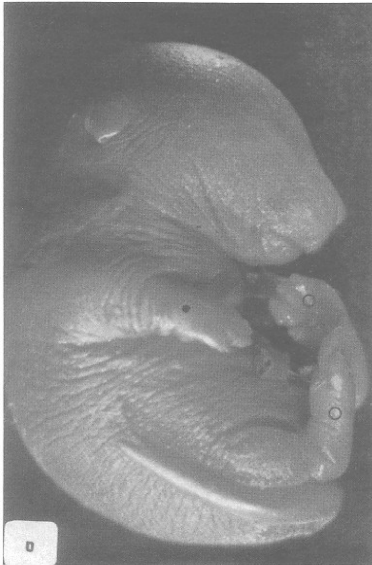
تصویر شماره ۲: نفاض شدید در سیستم اسکلتی میکروملیا در اندام فوقانی راست و عدم چرخش طبیعی و دفرمیتی در اندام تحتانی جنین حاصل از موش حامله دریافت کننده الکل و آسپیرین

است. وقوع ناهنجاری در مورفوژنز اندام های فوقانی و تحتانی در این گروه ۲/۲۴ درصد جنین ها را شامل می شود. در حالی که ناهنجاری اندام ها در هیچ یک از گروه های کنترل و گروه دریافت کننده سرم فیبرولوژی