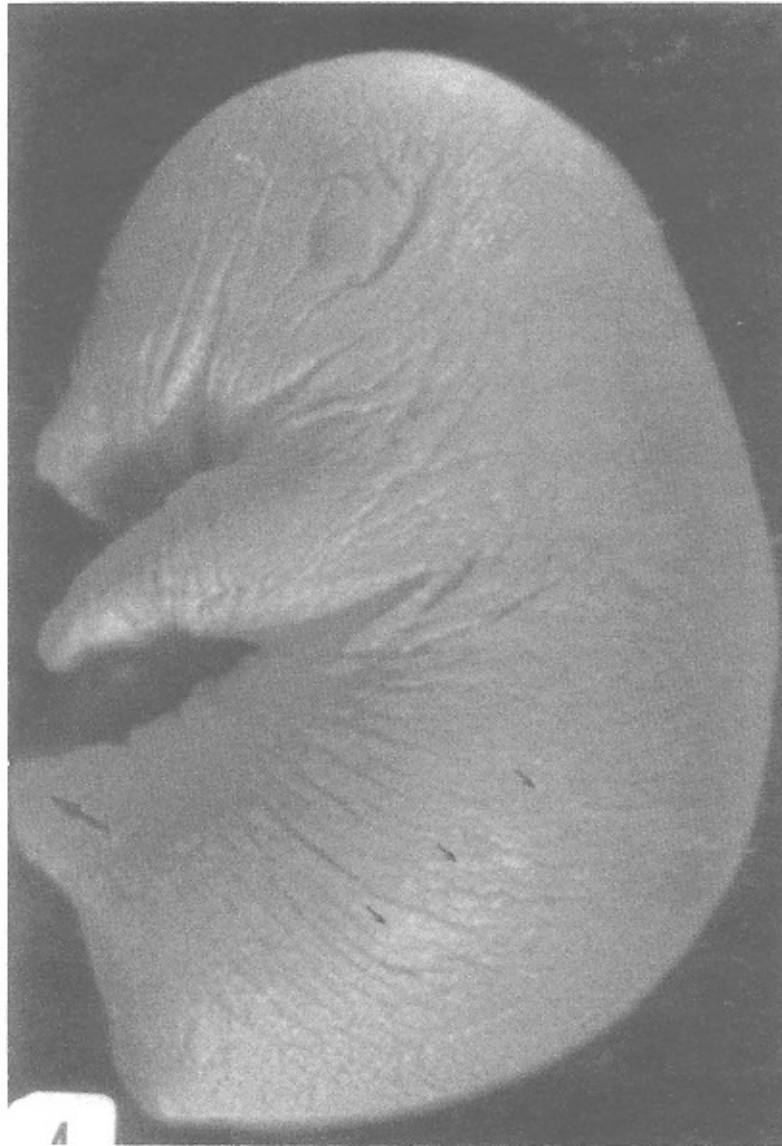
تصویر شماره ۳: دفرمیتی و عدم تکامل جوانه اندام تحتانی راست و چپ در جنین حاصل از موش دریافت کننده توام الکل و آسپرین

حرکتی و نقص در مورفوژنز طبیعی اندام ها می گردد. هم چنین کاهش وزن هنگام تولد، تأخیر رشد دوران قبل از تولد را نیز در مشاهدات خود ارائه نموده است (۹،۲،۱).