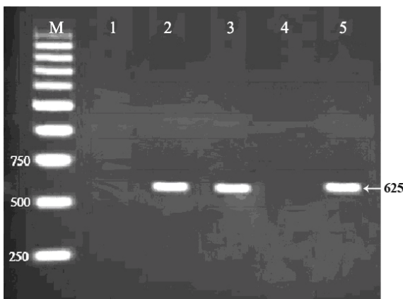
تصویر شماره ۲: نتایج PCR ژن H7 نمونه‌ها در ژل آگاروز ۱/۵ درصد. M: مارکر ۱ kb، ۱: کنترل مثبت، ۲: کنترل منفی، ۳ و ۵: نمونه‌های مثبت اشرشیاکلی H 7 ، ۴: نمونه منفی

میزان وقوع آلودگی لاشه‌های گوسفند به اشرشیاکلی O 157 :H 7 در طول فصل بهار و تابستان به ترتیب ۹/۷ و ۶/۶ درصد بود. این پاتوژن از نمونه‌های اخذ شده در طول فصول پاییز و زمستان جدا نشد. بر پایه این نتایج اختلاف آماری معنی داری بین وقوع آلودگی نمونه‌ها به اشرشیاکلی و اشرشیاکلی O 157 :H 7 در فصول مختلف سال مشاهده شد ( P < 0/05 ) (جدول شماره ۱). بر پایه نتایج به دست آمده از آزمون کشت اختلاف آماری معنی داری بین وقوع آلودگی نمونه‌ها به اشرشیاکلی O 157 :H 7 در فصول مختلف سال مشاهده نشد.