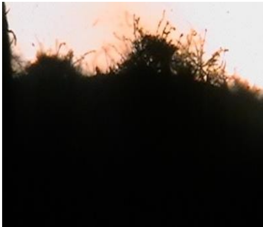
تصویر شماره ۲: بررسی میکروسکوپی رشد میسلیم قارچ متارایزیوم آنیزوپيله بر سطح کوتیکول کنه هیالوما