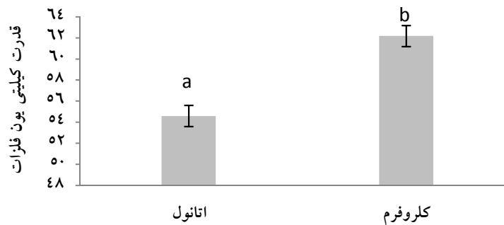
عصاره های جلبک سیستوسیرا ایندیکا

نتایج به شکل انحراف معیار± میانگین می‌باشد. حروف a,b,c,d,e اختلاف معنی‌دار در هر ستون و حروف l,m,n,o,p اختلاف معنی‌دار در هر ردیف را نشان می‌دهد. وجود حداقل یک حرف همنام نشان دهنده عدم اختلاف معنی‌دار در سطح احتمال ۹۵ درصد می‌باشد.