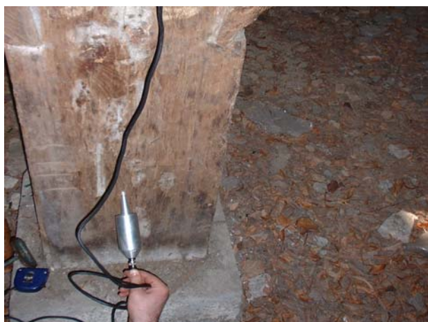
Slika 3. Ultrazvučni instrument Sylvaduo test s ugrađenim elementima