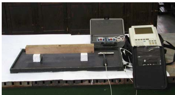
Slika 2. Ultrazvučno mjerenje MOE u