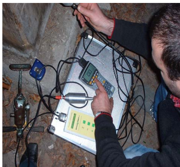
Slika 1 Između bilo koje dvije ulazne i izlazne varijable moguće je uspostaviti grafički tj. funkcijski odnos, npr. U ovom slučaju ( f_{c,90,k} - f_m )

Procedura pomoćne tehnike pri klasifikaciji sastoji se od mjerenja postotka vlažnosti, dimenzija i težine uzoraka. Svi ti ulazni podaci pohranjuju se u memoriju PC-a. Upotrebom jedne od nedestruktivnih tehnika, program izračunava dinamički MOE i kasnije sve karakteristične vrijednosti mehaničkih svojstava drva koje su nam potrebne pri projektiranju drvenih konstrukcija. Naravno, podrazumijeva se da neuralna mreža primijeni na što više uzoraka koji su i destruktivno ispitani te da se njezini rezultati stalno testiraju nakon određenog broja prolaza.