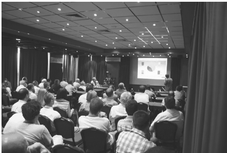
Slika 2. Seminar o primjeni ICT-a u elektroprivrednoj organizaciji

dimenzionalnih modela za strojarsku, arhitektonsku, građevinsku i slične struke.