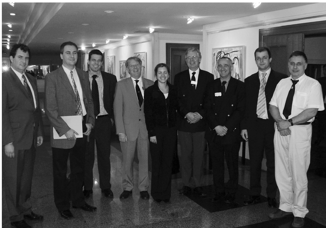
Slika 2. Sudionici SatNav & LBS Workshop-a