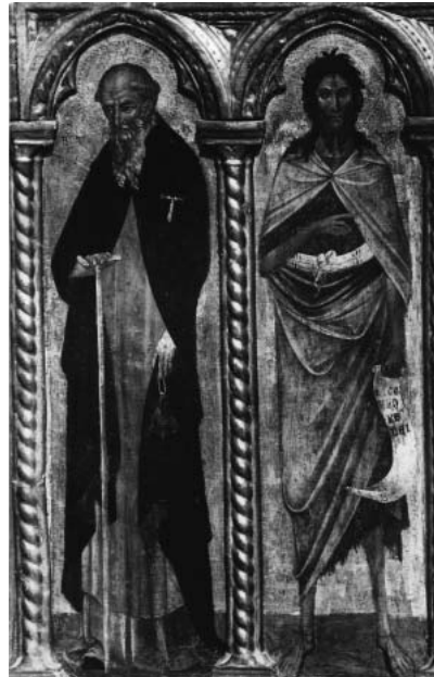
Sv. Ante i sv. Ivan Krstitelj, poliptih, crkva sv. Ante, Koločep