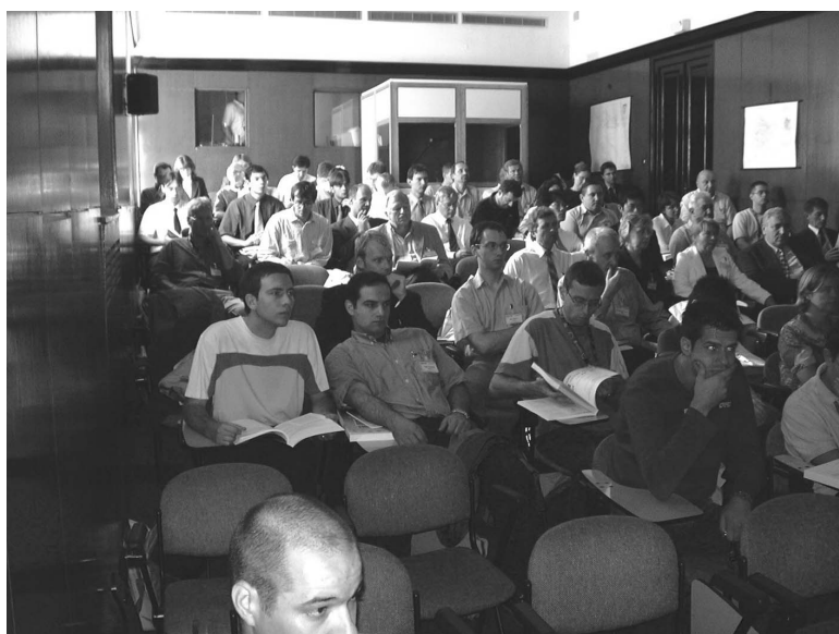
Sl. 2. Otvaranje Skupa u velikoj dvorani Međunarodnog središta hrvatskih sveučilišta

Radni dio skupa započeo je nakon otvaranja plenarnom sekcijom u kojoj je profesor Y. Rahmat-Samii s UCLA održao predavanje o novim postignućima u metodama optimizacije elektromagnetskih sustava pomoću genetskih algoritama.