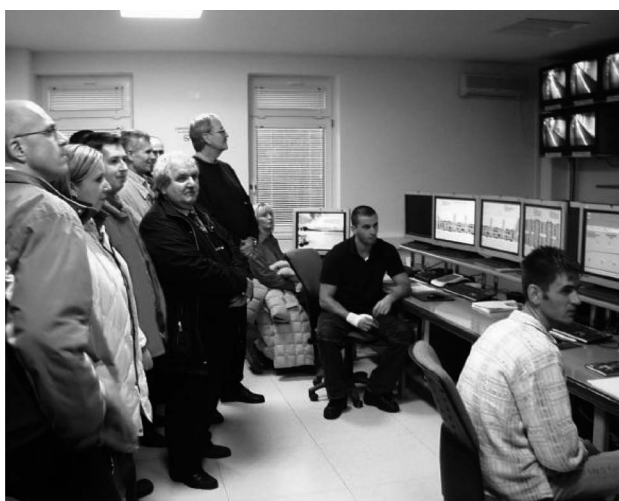
Sl. 1. Razgledavanje centra za upravljanje prometom Tunela Sv. Rok

Sekcija Cestovni promet prikazala je radove o uputno-parkirno-garažnom sustavu u gradu Rijeci, iskustvima u primjeni sustava automatskog upravljanja prometom u gradu Rijeci, dilemi o primjeni automatskog uključivanja svjetala na vozilima, izvedbi i praćenju višenamjenskog komercijalnog parkirališta u Zračnoj luci Zagreb, novom pristupu problemu parkiranja i mobilnosti osoba s inva-