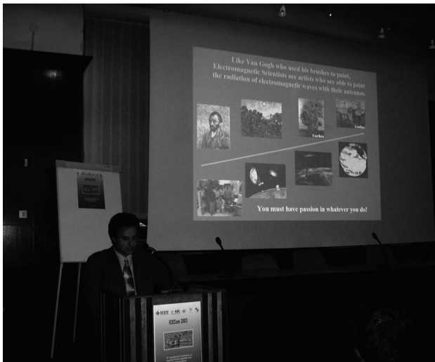
Sl. 3. Predavanje prof. Yahye Rahmat-Samiija na plenarnoj sekciji skupa

Rad skupa nastavljen je u tri paralelne sekcije. Tijekom radnog dijela skupa održano je ukupno 17 sekcija u kojima je obrađeno više tematskih cjelina koje se mogu grubo podijeliti na skupinu o antenama i antenskim nizovima, skupinu o komunikacijskim sustavima, skupinu o ostalim radiofrekvencijskim sustavima (radari, navigacija, itd.) te skupinu o numeričkom modeliranju u elektromagnetizmu.