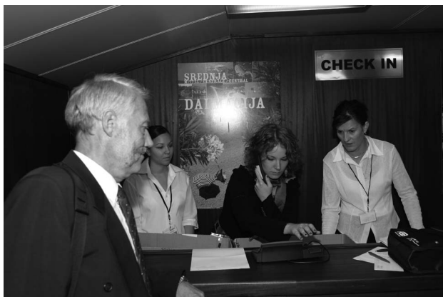
Sl. 2. Registracija i smještaj sudionika

plovidbe Jadranom i pristajanja u svjetski poznatim gradovima, zasigurno je jedan od razloga takvog rasta. Drugi je važan razlog visoka kvaliteta same konferencije. Tu je kvalitetu prepoznala i udruga IEEE ( Institute of Electrical and Electronics Engineers , najutjecajnija svjetska udruga na području elektrotehnike i ICT tehnologije sa sjedištem u SAD) koja već šestu godinu za redom sponzorira Konferenciju.