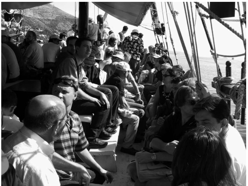
Sl. 4. Izlet brodom na otok Supetar i u grad Cavtat

U sekciji o elektromagnetskoj kompatibilnosti i industrijskim primjenama mikrovalova značajna je tema bilo djelovanje elektromagnetskih valova baznih postaja po-