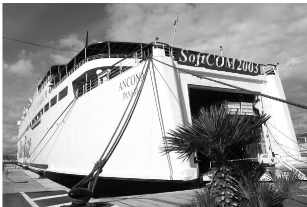
Sl. 1. »Ancona« – brod domaćin konferencije SoftCOM 2003

Jedanaesta međunarodna konferencija o softveru, telekomunikacijama i računalnim mrežama SoftCOM 2003. održana je od 7. do 10. listopada 2003. godine. Konferencija SoftCOM 2003. poznata je po tome što se već šestu godinu održava na brodu koji plovi između hrvatske i talijanske obale Jadranskog mora. Ovaj je put to bio brod »Ancona« na atraktivnoj ruti Split–Venecija–Ancona–Dubrovnik.