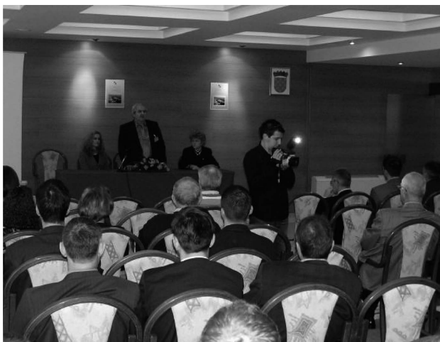
Sl. 2. S radnog dijela skupa

luditom, lokacijskim značajkama distribucije prometnih nesreća u Hrvatskoj, novim spoznajama o ozljedama vratne kralježnice te o mjerenju reflektirajućih sustava površine cesta, cestovne signalizacije i prometnih znakova. Sastavni dio ove sekcije bio je i tradicionalni okrugli stol Mobilnost osoba s invaliditetom kojem je bio nazočan velik broj osoba s invaliditetom s područja Zadra i cijele Hrvatske. Razgledavanje centara za upravljanje prometom Tunela Sv. Rok i Mosta Maslenica održano 19. studenom također je bilo dio ove sekcije.