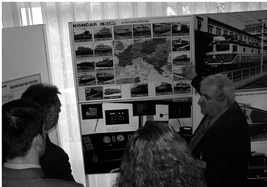
Sl. 3. Izložbeni prostor na skupu

Zbog povećanog broja radova sekcija za Željeznički promet održana je u dva dijela. U prvom su dijelu prikazani radovi o rezultatima modernizacije pomoćnog pogona tramvajskih vozila Zagrebačkog električnog tramvaja (ZET), rezultatima ispitivanja uzoraka ugljenogرافitnih klizača na oduzimačima struje tramvajskih vozila ZET-a nakon realizacije prve faze programa zamjene, prometno-gradevinskoj studiji uspinjače na Trsat u Rijeci, metrou kao nositelju masovnog tračničkog prijevoza putnika u velikim gradovima, uvođenju nove generacije brzinomjersko-registrirajućih sustava za tračnička vozila, utjecaju centraliziranog nadzora registriranih uređaja na raspoloživost signalno-sigurnosnih uređaja za upravljanje željezničkim prometom, traženju slabih mjesta u željezničkim signalno-sigurnosnim uređajima. U drugom su dijelu prikazani radovi o rezultatima u razvoju i primjeni informacijskog sustava održavanja vučnih vozila, suvremenim rješenjima primjenjenim kod rekonstrukcije i modernizacije lokomotiva BDŽ serije 44 (Škoda E 68), klimatizaciji putničkog vagona »Bl« izvedenoj pri njegovoj rekonstrukciji, modernizaciji kočnice na rekonstruiranim putničkim vagonima, daljinskom upravljanju i signalizaciji u putničkim vagonima te emisiji onečišćujućih tvari u zrak iz mobilnih izvora – lokomotiva. U okviru ove sekcije održan je i okrugli stol Za pet sati vlakom od Zagreba do Dalmacije koji je izazvao veliko zanimanje svih sudionika skupa i