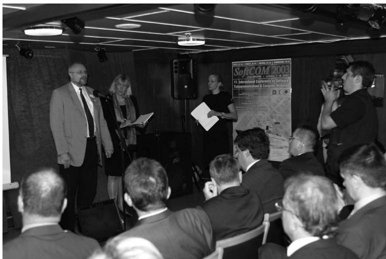
Sl. 3. Pozdravna riječ predstavnika IEEE Algirdasa Pakštasa na otvaranju konferencije SoftCOM 2003

Održavanje konferencije SoftCOM na brodu povezuje obale Jadranskog mora. Brod je preko dana privezan u luci, a preko noći plovi prema sljedećem odredištu. Jedanaesti SoftCOM posjetio je atraktivne gradove duž hrvatske i talijanske obale jadranskog mora: Split, Veneciju, Anconu i Dubrovnik. To je bila i jedinstvena prilika