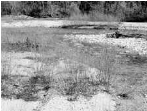
Fig. 6. Macrozoobenthos samplings location

Studenti su podijeljeni u četiri grupe od kojih je jedna grupa započela s metodologijom istraživanja populacija riba, druga sa zooplanktonom, treća s makrozoobentosom, a posljednja s ekomorfološkom metodom. Svaka od ovih tema započeta je uvodnim predavanjima, najveći se dio nastave provodio na terenu, a krajnji je rezultat bio determinacija i obrada podataka (Slika 4, 5 i 6).