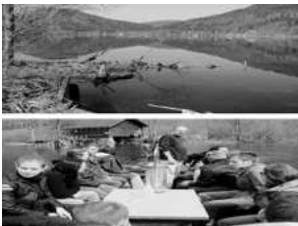
Slika 4. Detalj s praktičnih vježbi uzorkovanja zooplanktona Fig. 4. Detail from zooplankton samplings practice exercises