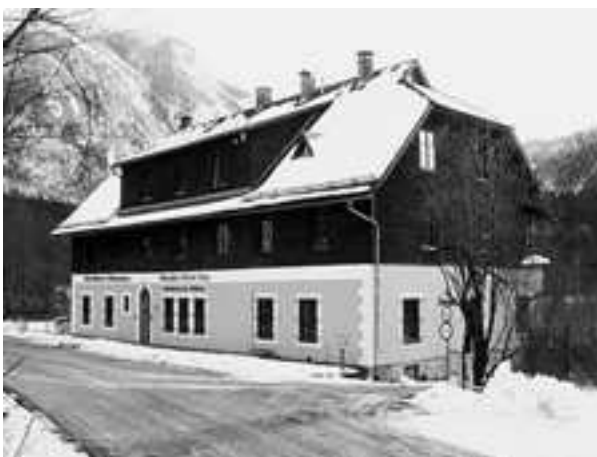
Slika 1. Hidrobiološka stanica u Lunz am See Fig. 1. Hydrobiology station in Lunz am See

Na Donjem jezeru i u okolnim potocima održavala se praktična nastava iz hidrobiologije. Ondje je bilo prisutno 80–ak studenata raznih profila, nastava se je održavala na engleskom jeziku, a glavni je koordinator bio prof. dr. sc. Jungwirth Mathias.