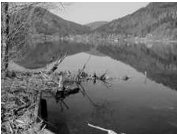
Slika 3. Donje jezero »Untersee« Fig. 3. Lower Lake »Untersee«