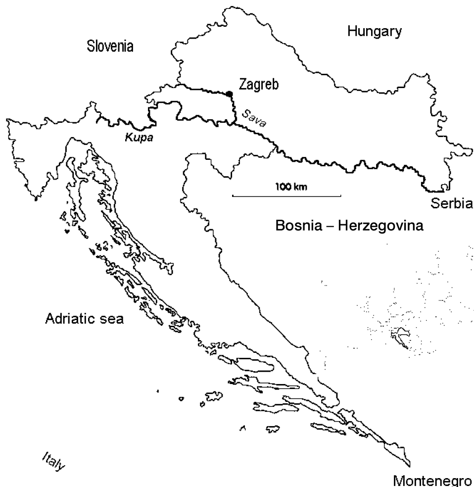
Slika 1. Smještaj istražene rijeke Fig. 1 The location of investigated river