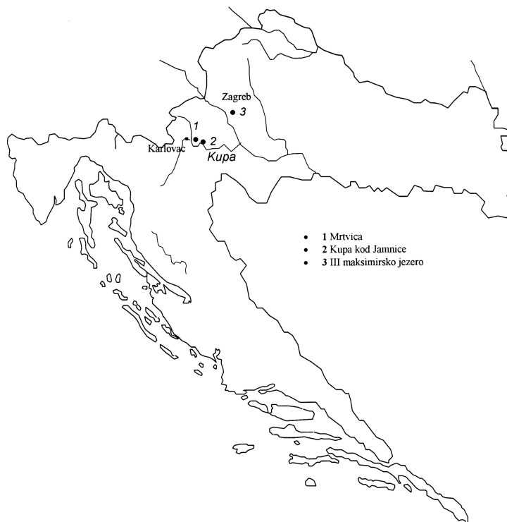
Slika 1. Smještaj istraženih lokacija bodorki Fig. 1 Location of roach populations investigated