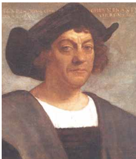
Christopher Columbus Kristofor Kolumbo

Italy is honoured to celebrate Columbus Day, at last