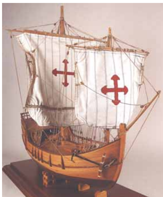
Columbus's Niña Kolumbova Niña

Iako se Kolumbov dan odnosi na određeni dan, događaj obuhvaća mnogo dulje povijesno razdoblje geografskih otkrića, širenja i kartografije. Kao svoj prinos 500. godišnjici prvog susreta dvaju svjetova, Italija je 1992. godine osnovala Vijeće petstoljetnog jubileja Kristofora Kolumba i njegova doba otkrića . Vijećem je predsjedavao profesor Paolo Emilio Taviani, koji je na XVII Congresso Geografico Italiano 4-9 maggio 1992 u srednjovjekovnoj luci Genove rekao kako je jubilej Kolumba 1992. samo početak niza izvanrednih proslava glavnih geografskih istraživanja nepoznatih zemalja preko zapadnog oceana, koji će završiti 2006. Kristofor Kolumbo zapravo je četiri puta putovao u Novi svijet