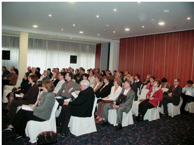
Sudionici savjetovanja Polimerni materijali i dodatci polimerima

Tradicionalno savjetovanje Društva za plastiku i gumu pod nazivom Polimerni materijali i dodatci polimerima održano je 17. i 18. studenoga 2005. u Zagrebu. Svrha savjetovanja bila je upoznati sudionike sa stanjem i perspektivom industrije polimera u Hrvatskoj i regiji te s novim načinima karakterizacije i modifikacije širokoprimitivnih polimera. Savjetovanje je zaokruženo predstavljanjem istraživanja na polimernim kompozitima posebnih svojstava i primjene te premijernim forumom seniora .