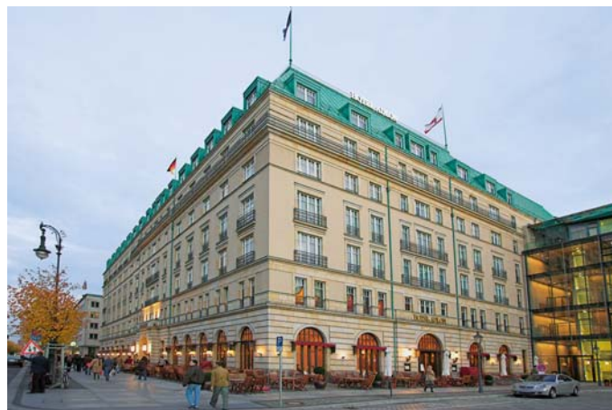
SLIKA 1. Hotel Adlon-Kempinski

Međunarodno poznati proizvođač poliolefina, Borealis , organizirao je u Berlinu u hotelu Adlon-Kempinski 26. i 27. listopada 2005. vrlo zanimljiv skup (slika 1).