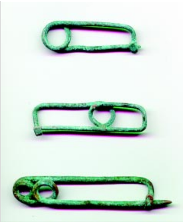
Sl. 2. Fibule u obliku violinskog gudala iz Male gore