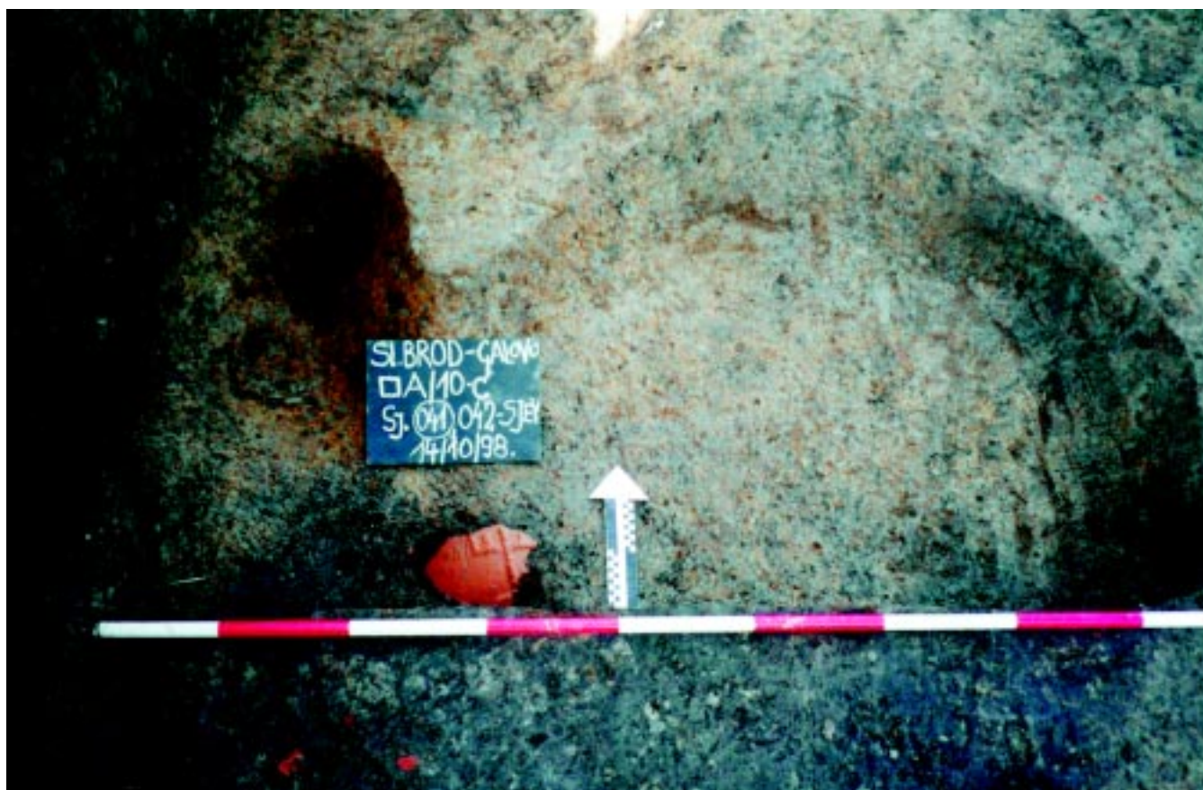
Sl. 7. Slavonski Brod - Galovo, jama SJ 041, nalaz dijela lonca s prikazom ženskog lika tehnikom plastičnog modeliranja