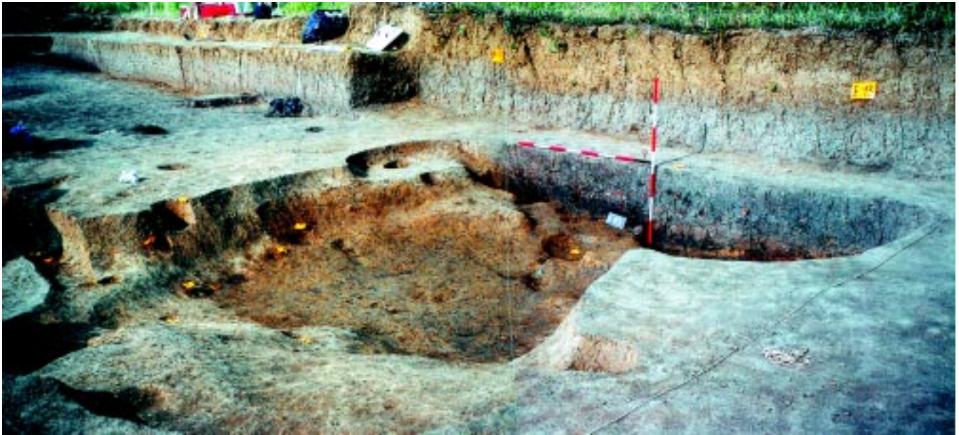
Sl. 3. Slavonski Brod - Galovo, sjeverozapadna stambena zemunica SJ 153 u fazi istraživanja