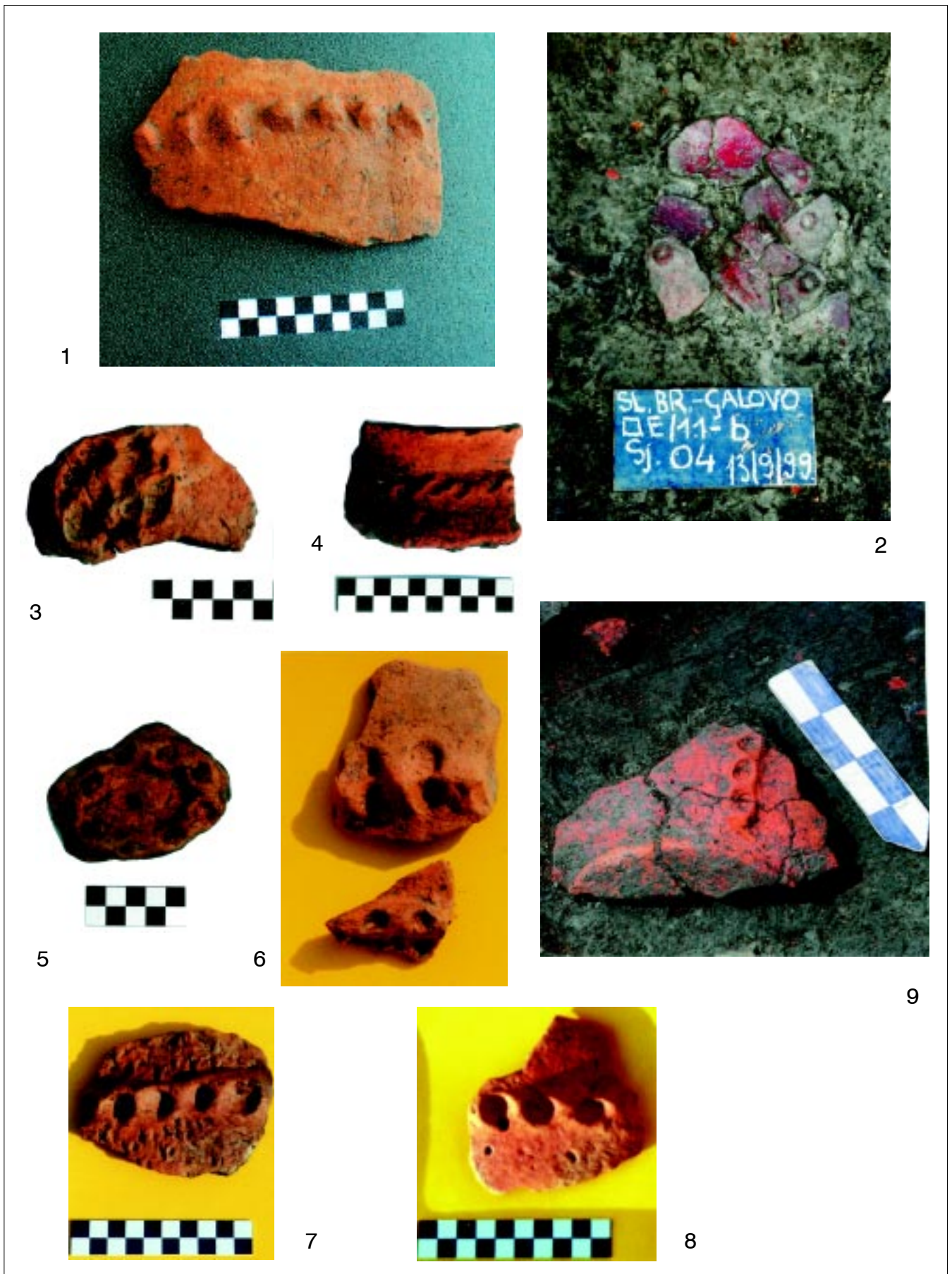
Sl. 6. Slavonski Brod - Galovo, gruba keramika ukrašena plastičnim modeliranjem