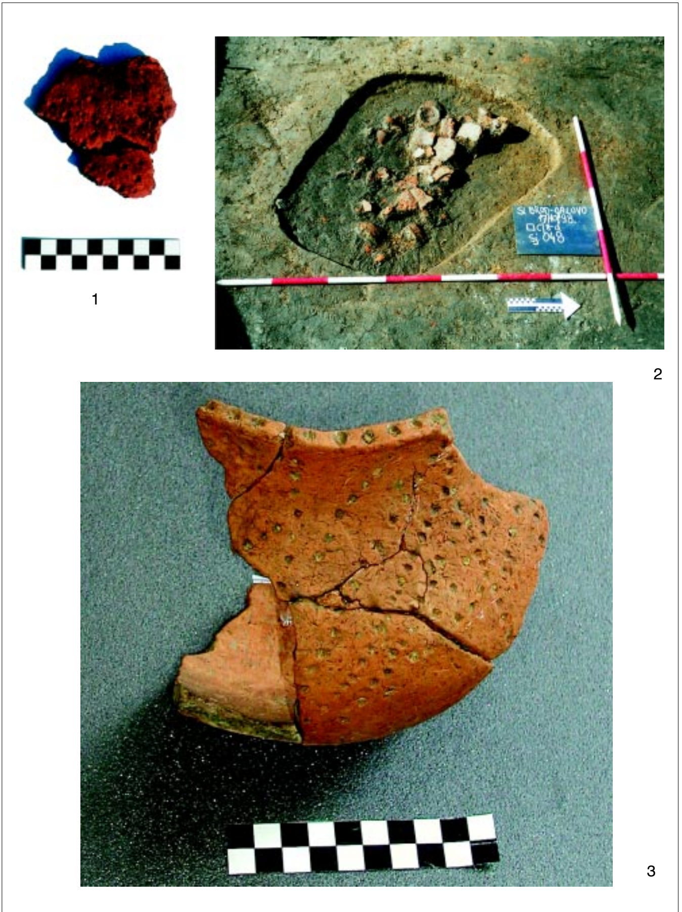
Sl. 5. Slavonski Brod - Galovo, gruba keramika ukrašena tehnikom ubadanja