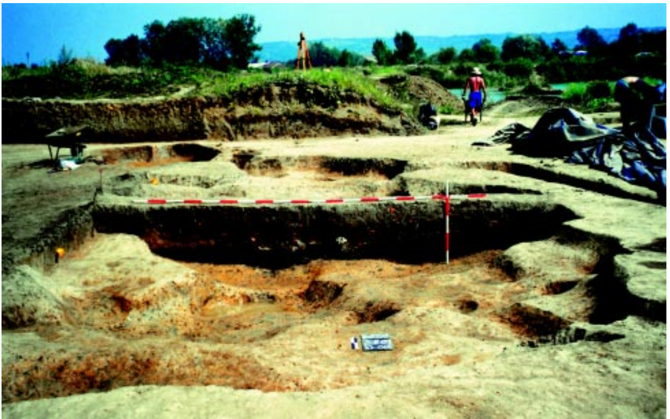
Sl. 2. Slavonki Brod - Galovo, sjeverna stambena zemunica SJ 064 u fazi istraživanja. Kontrolni profil (istok-zapad) i ulazna stepenica na istočnoj strani zemunice