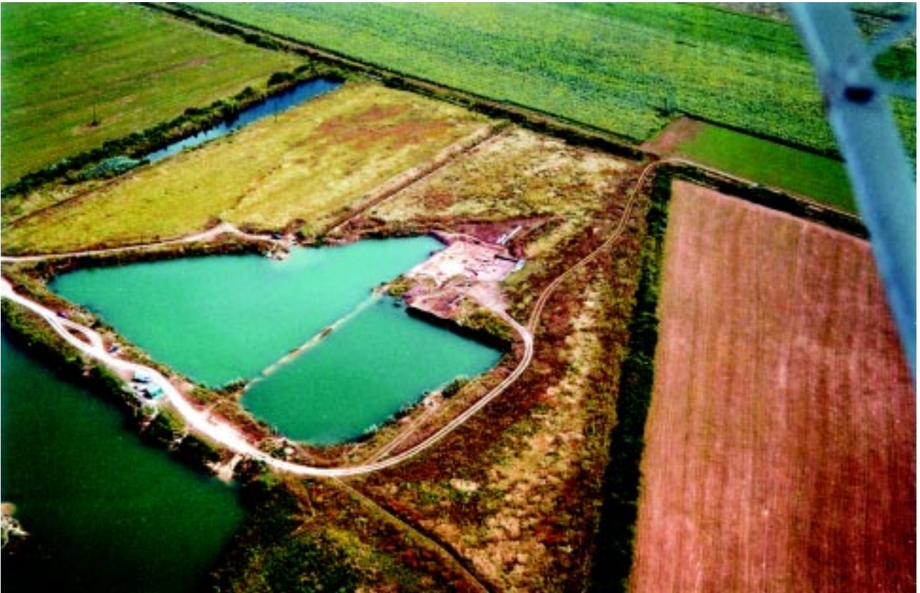
Sl. 1. Slavonki Brod - Galovo, zračna snimka istraženog terena starčevačkog naselja koje se prostire i na okolnim zemljištima