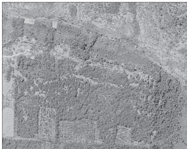
Sl. 2. Gradina Kremik. Detalj zračnog snimka gradine

Čitava površina unutar bedema kao i padine izvan, a posebice grudobran, puni su ulomaka keramičkih posuda, kako onih što pripadaju pretpovijesnom razdoblju, tako i ulomaka karak-