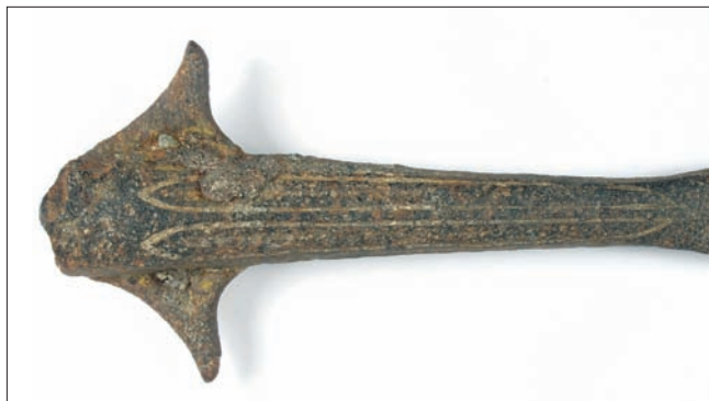
Sl. 2.a – Detalj ukrasa na tuljcu koplja s krilcima iz šljunčare Jegeniš – prikaz A strane