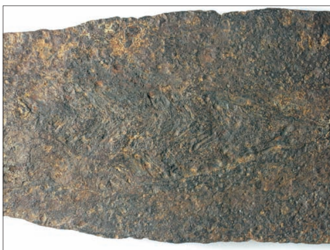
Sl. 5.b – Detalj s motivom riblje kosti na bodilu koplja s krilcima iz šljunčare Jegeniš – prikaz B strane

Abb. 5a - Detail mit Fischgrat- und Mäandermotiv an der Spitze der Flügellanze aus der Kiesgrube Jegeniš – Darstellung der B-Seite