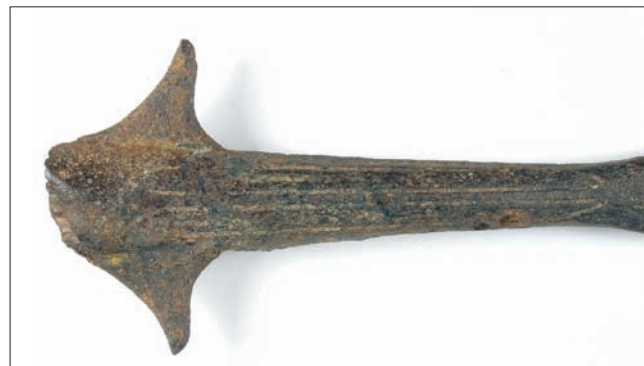
Sl. 2.b – Detalj ubrazdanog ukrasa na tuljcu koplja s krilcima iz šljunčare Jegeniš – prikaz B strane