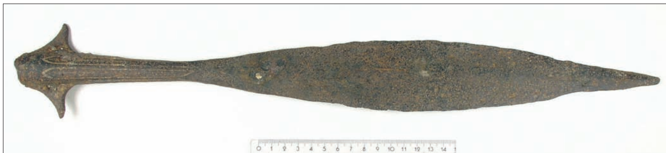
Sl. 1.a – Koplje s krilcima iz šljunčare Jegeniš – prikaz A strane