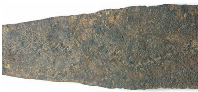
Sl. 5.a – Detalj s motivom riblje kosti i meandra na bodilu koplja s krilcima iz šljunčare Jegeniš – prikaz B strane

Abb. 5a - Detail mit Fischgrat- und Mäandermotiv an der Spitze der Flügellanze aus der Kiesgrube Jegeniš – Darstellung der B-Seite