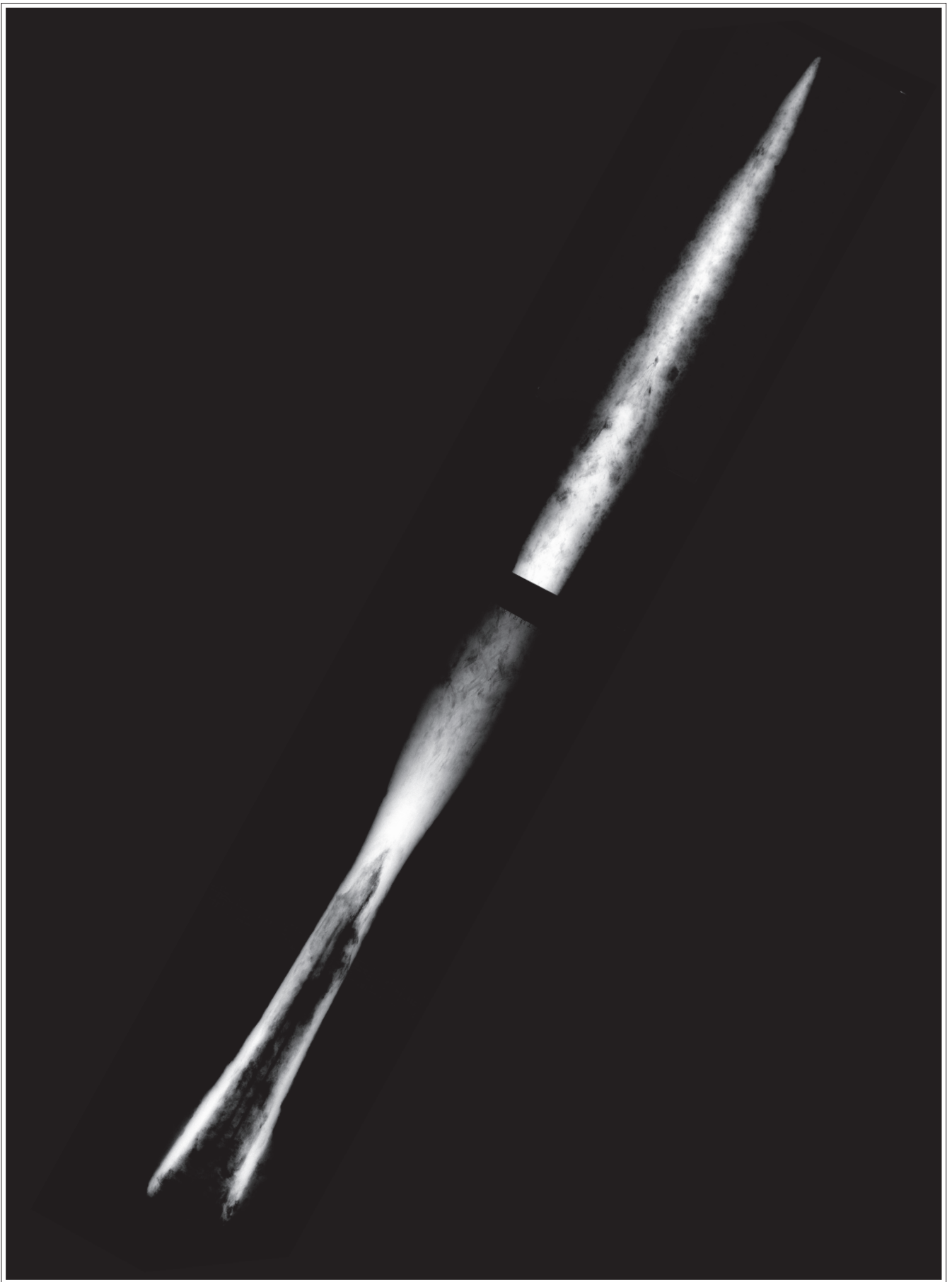
Sl. 6. – Rendgenski snimak koplja s krilcima iz šljunčare Jegeniš