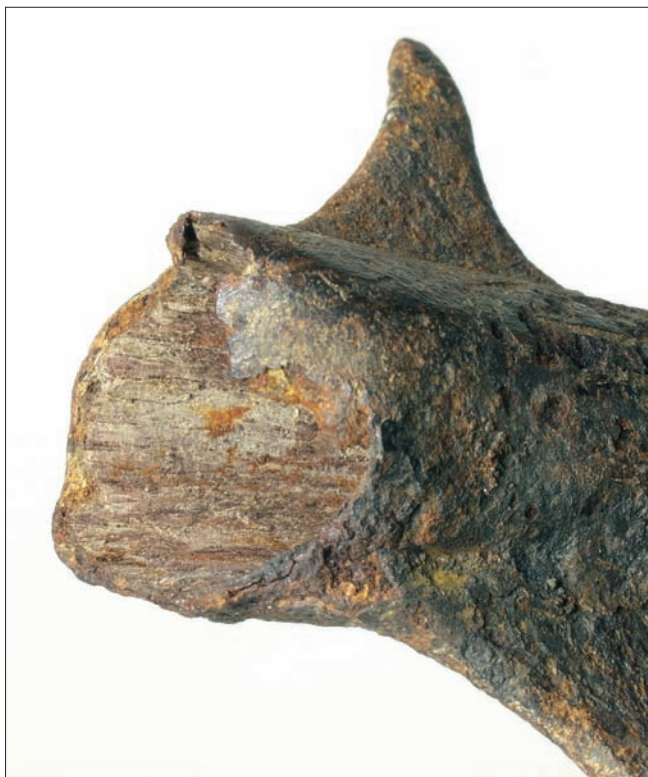
Sl. 3. – Detalj očuvanog drva u unutrašnjosti tuljca koplja s krilcima iz šljunčare Jegeniš

Abb. 3 - Detail des erhaltenen Schafts innerhalb der Tülle der Flügellanze aus der Kiesgrube Jegeniš