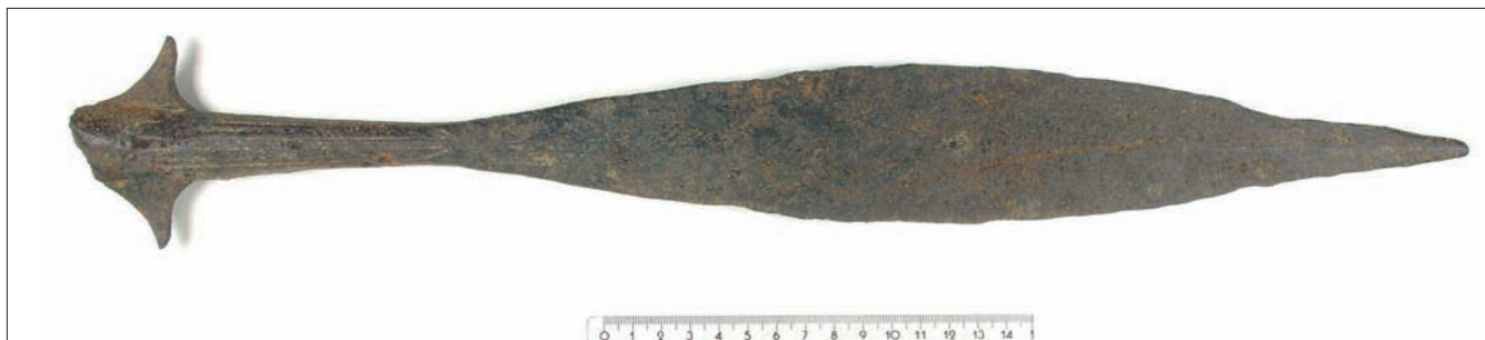
Sl. 1.b – Koplje s krilcima iz šljunčare Jegeniš – prikaz B strane