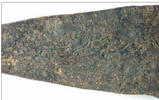
Sl. 5.c – Detalj s motivom meandra na bodilu koplja s krilcima iz šljunčare Jegeniš – prikaz B strane

Abb. 5b - Detail mit Fischgratmotiv an der Spitze der Flügellanze aus der Kiesgrube Jegeniš – Darstellung der B-Seite