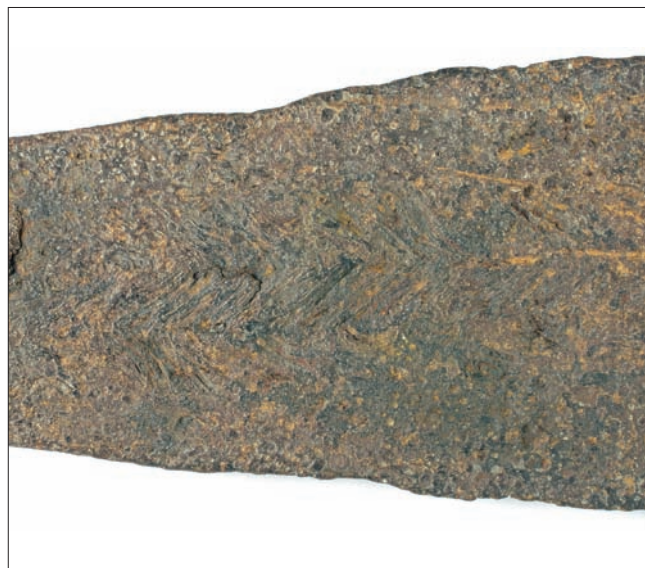
Sl. 4. – Detalj s motivom riblje kosti na bodilu koplja s krilcima iz šljunčare Jegeniš – prikaz A strane

Motiv-uzorak na koplju iz šljunčare Jegeniš ne pokazuje u potpunosti iste elemente spajanja damastnih šipki sa svake strane bodila koplja. Na obje je strane složenija varijanta motiva riblje kosti tzv. N oblik šare, tj. spojene su tri šipke od