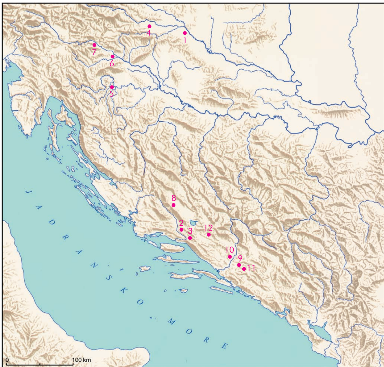
Karta 2. – Rasprostranjenost kopalja s krilcima na području Hrvatske, Bosne i Hercegovine i Slovenije: 1. – šljunčara Jegeniš; 2. – rijeka Cetina kod Trilja; 3. – Poletnica kod Zadvarja u omiškom zaleđu; 4. – Varaždin; 5. – rijeka Mrežnica kod Duge Rese; 6. – rijeka Ljubljanica kod Rakove Jelše; 7. – Sebenje kod Bleda; 8. – Rudići kraj Glamoča; 9. – Stolac «Čaire»; 10. – Mogorjelo; 11. – Hatelj kod Stoca; 12. – Vir kod Posušja.