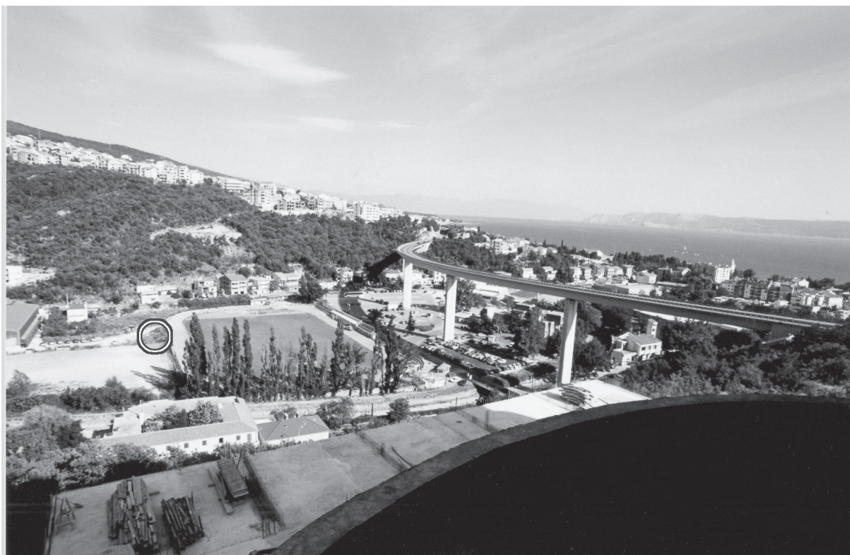
Plan 1. Pogled na istraženu površinu na lokalitetu Crikvenica - "Igralište" 2004. godine