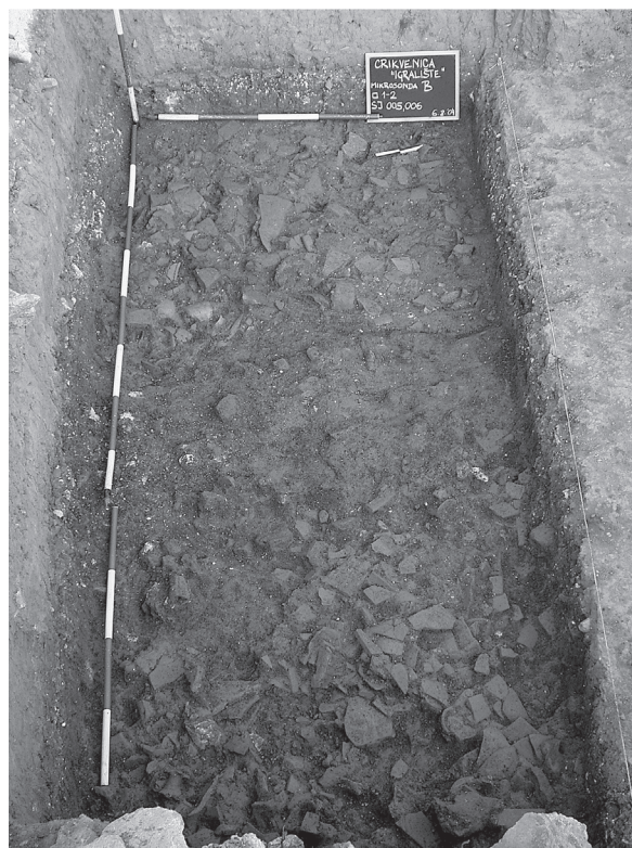
Sl. 2. Antički kulturni sloj s keramičkim teracom Fig. 2. Antiquity cultural layer with ceramic terrazzo

Uz znatniju koncentraciju keramičkih ulomaka u SJ 004, znakoviti su nalazi keramičke troske. Uz trosku je nađena manja koncentracija gara, gotovo samo u tragovima. Javljuju se i manji ulomci životinjskih i ljudskih kostiju.