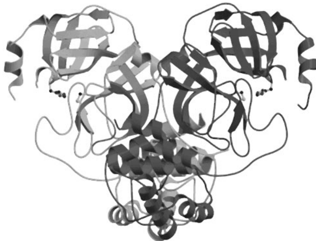
Struktura glavne proteaze SARS-a koja je temelj za otkrivanje lijeka ( http://www.anl.gov )

šest temeljnih baza podataka, koje se stalno nadopunjuju novim kristalnim strukturama i izrađuje se prikladan softver koji omogućuje što jednostavnije pretraživanje podataka i njihovu obradu. Tako ove godine Cambridge Structural Database obilježava 40. godišnjicu postojanja i rada.