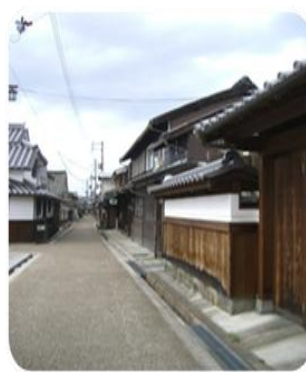
写真22：地中化されていない街道