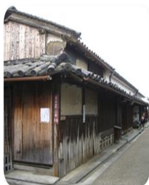
写真21：老朽した長家

今井町においては、空き家問題以外、写真21と写真22のように、老朽化が進む長屋や電線が地中化されていない街道も見られた。しかし、老朽化しつつある町家の修復と維持のために資金支援する仕組みが不足しているのが現状である。