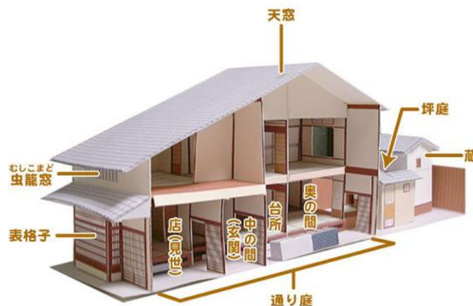
図1. 京町家の空間構成図

次に、空間構成について述べる。図1は、四条地区にある京町家の空間構成を表したものである 8 。図1の各部位の名称について、写真1から写真10で示している。