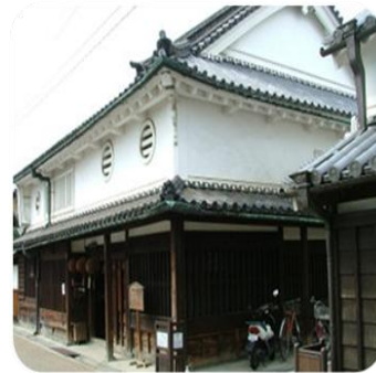
写真20：今井町・町家