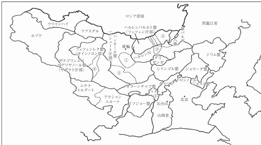
清代モンゴルの概略図

ーンの支配下にあった。アルタン・ハーンの時代におけるトゥメト部族の遊牧地は、現在の内モンゴルにおけるボート(包頭)、ウラーンチャブ地方やバヤーンノール地方のウラト三旗の全地域まで広がっていたため、夏は涼しい北方に移動し、冬は大青山 2) の南方に冬営した(地図を参照、萩