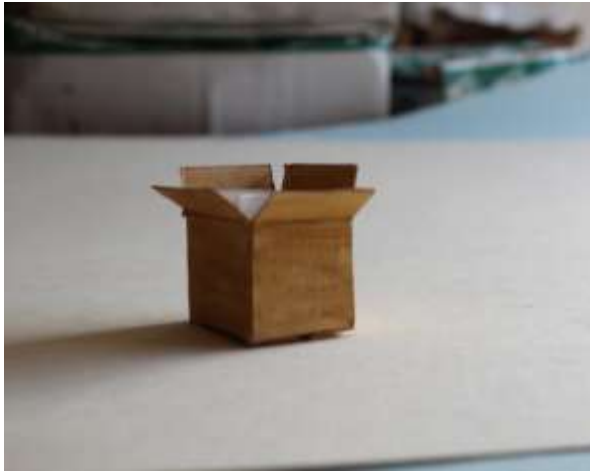
Figura 7. Prueba 7