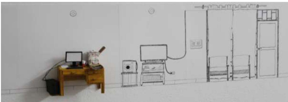
Figura 9. Prueba 9

Exponer la medida en que se habita en un lugar “propio” siendo Nómada en nuestra propia casa.