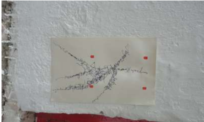
Figura 2. Prueba 2