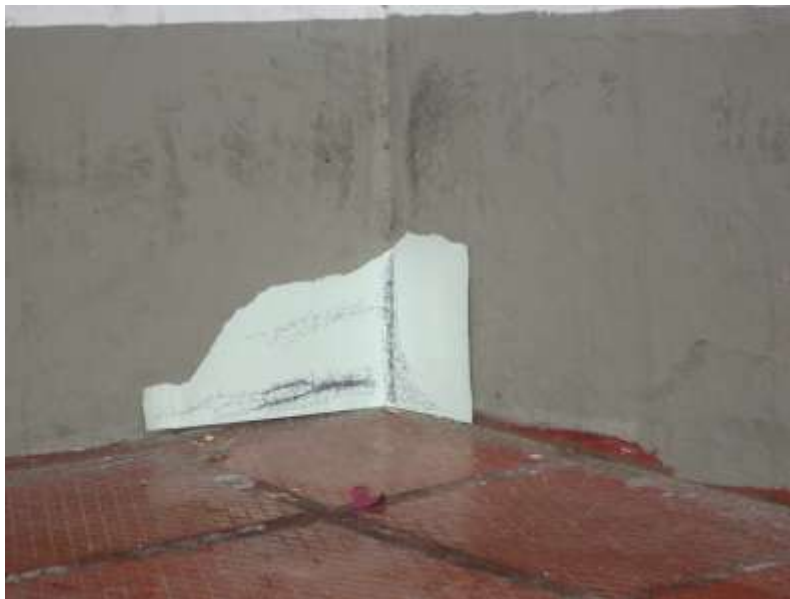
Figura 1. Prueba 1

En esta etapa apropié los espacios abandonados y a través de elementos elaborados con base en papel desechado, intervine mediante escenas y/o imágenes propias del lugar a través de grafismos o dibujo figurativo, en dicho momento fue necesario alimentar mi trabajo con referentes claves fue así como León Ferrari, Slikanchu, Liliana Porter, Isaac Cordal.