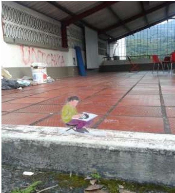
Figura 5. Prueba 5