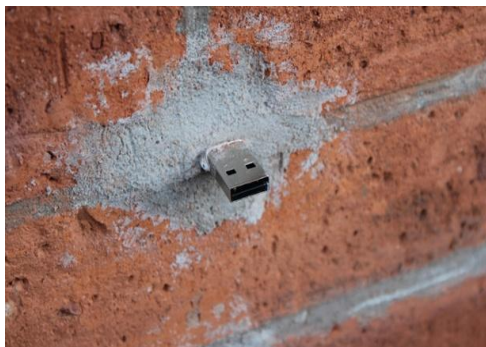
Imagen izquierda: Aram Bartholl conectado a uno de los dead drops ; imagen derecha: un USB insertado en el muro

Actuando en campos diferentes a Aram Bartholl encontramos a Christian Nold, cuya obra es catalogada como cartografía emocional, el precursor del bio mapping o emotional mapping 4 . Ésta es una metodología y una herramienta para la visualización de las reacciones y