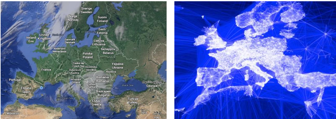
Imagen izquierda: captura de imagen; imagen derecha: Visualizing Friendships , de Paul Butler, diciembre de 2010

Butler: “Lo que realmente me impactó es que las líneas no representan las costas, los ríos o las fronteras políticas, sino las relaciones humanas”.