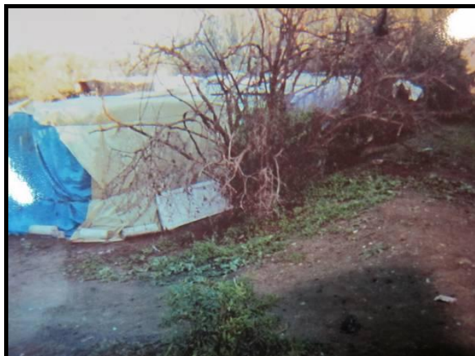
Imagen 2: Chabola en Melilla.