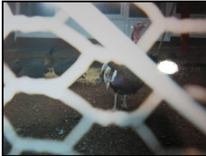
Imagen 4. La granja.