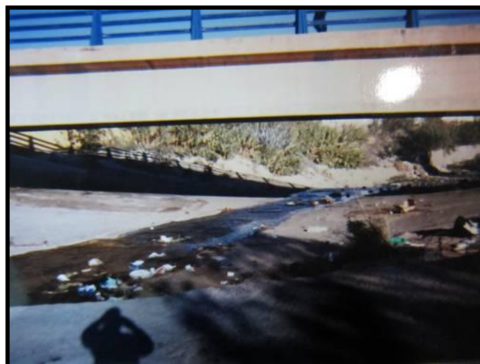
Imagen 5. Autorretrato cerca del CETI.