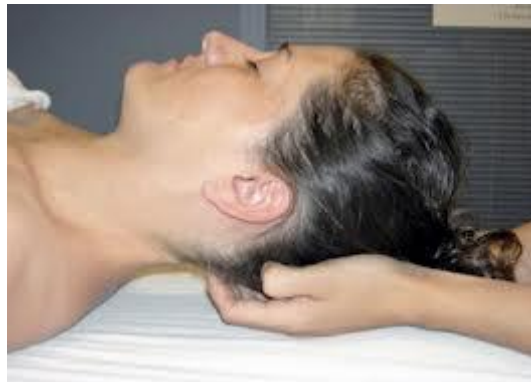
Inducción miofascial de los músculos suboccipitales

Se pueden realizar técnicas de inducción miofascial en el músculo esternocleidomastoideo, extensores cervicales, trapecios superiores, músculos escalenos, largo del cuello y de la cabeza y muy importante para la cefalea tensional, triángulo suboccipital.