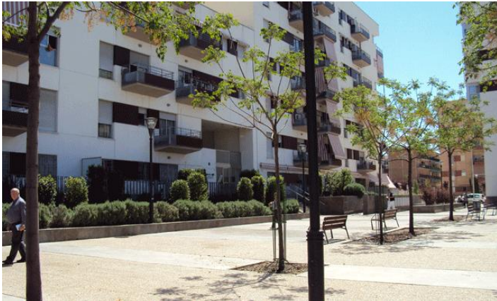
Plaza Nuevo Zaidín