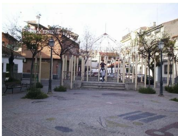
Plaza de las Palomas