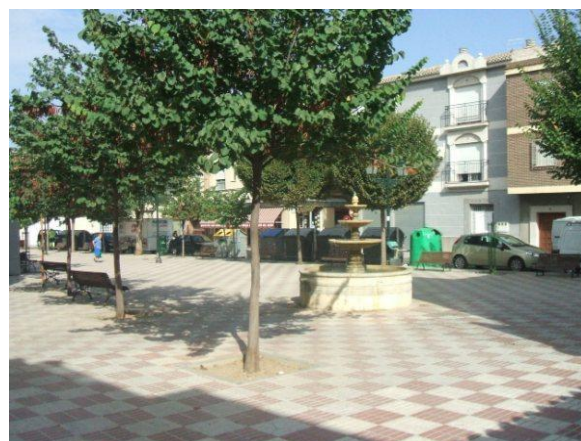
Plaza Federico Mayo