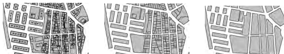
Figura 1. Las unidades básicas superficiales de la cartografía catastral (construcciones, parcelas y manzanas).