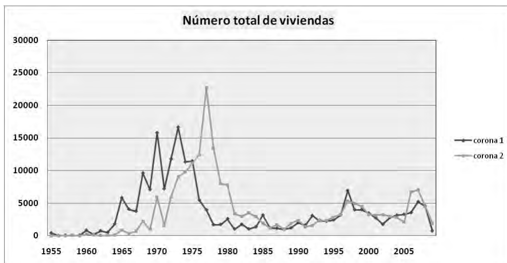
Figura 4. Evolución del volumen anual de viviendas construidas, desde 1955 hasta 2009, en los municipios del Sur de Madrid (diferenciados por coronas de proximidad a la capital), según el año de su construcción.

incremento de población muy elevados (620.000 personas en el periodo 1960-75), en un modelo de crecimiento a saltos, apoyándose en municipios de escaso peso poblacional (Santos Preciado, 1990). Este modelo de crecimiento urbano resultó ser paradigmático en el sur de la ciudad. En un primer momento, desde 1965 sobre todo, crecieron los municipios de la primera corona (Getafe, Leganés y Alcorcón), para, a continuación, a partir de 1972, crecer los municipios de la segunda (Fuenlabrada, Móstoles, Parla y Pinto) como si de una ola expansiva se tratara.