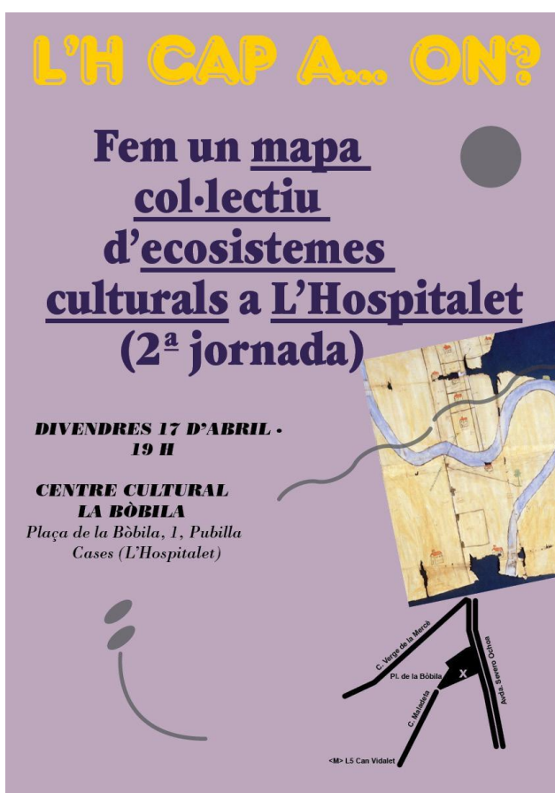
Cartel de la segunda jornada abierta, L'H CAP A... ON? (¿L'H hacia... donde?), dirigida a los agentes culturales de la ciudad para debatir la propuesta del futuro distrito cultural que propone el ayuntamiento

Otra de las cuestiones es la de los modelos político-económicos desde donde abordar lo cultural , y las agendas ideológicas de fondo que vienen manejando lo cultural, siempre al servicio de la construcción de la identidad que convenga más al partido en el mando.