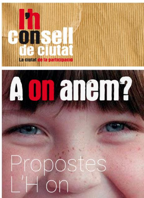
Cartel del consejo de ciudad de L'H (acrónimo de l'Hospitalet de Llobregat).

El humo y la propaganda de las ideas, los titulares, las esperas y las animaciones en tres dimensiones dilapidan un posible diálogo con los ciudadanos, o quizás hace que lo fomente. De hecho, no sin estos habría sido posible una reunión alternativa. Alguien sugiere que la administración utiliza el silencio cultural de la ciudad para actuar a voluntad. Sin embargo, esto no representaría una decisión intencionada tanto como una consecuencia de la hablada sectorización de los agentes.