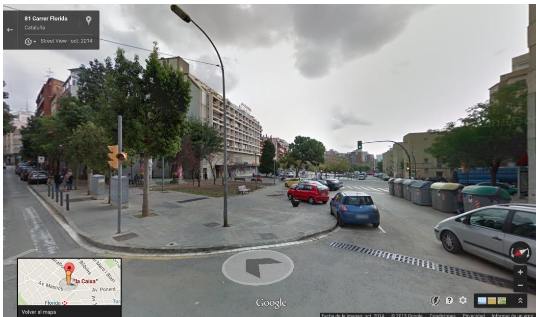
Calle Florida en l'Hospitalet de Llobregat, en el barrio de La Florida.