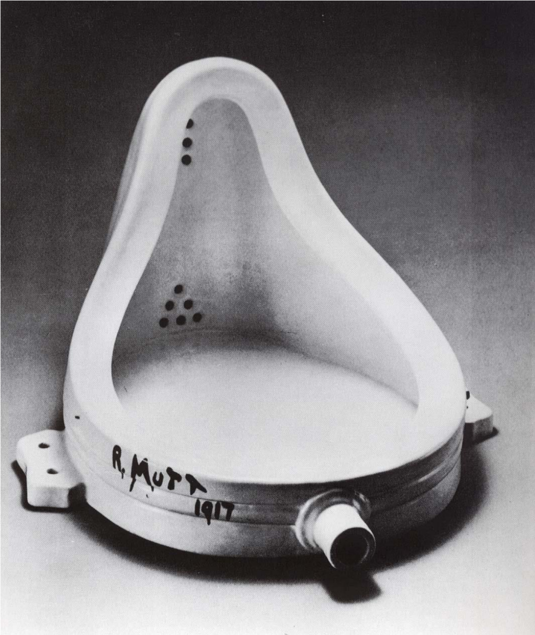
Marcell Duchamp, La fuente . Nueva York, 1917.

¿Qué nos hace ser aceptados por una sociedad de consumo?, ¿por qué debemos seguir ciertos modelos de comportamiento?, ¿dónde se encuentra la creatividad, las nuevas formas de reivindicar que no se encuentra dentro de tus valores, de la arquitectura, la vida y esa esencia humana para ti están más allá de las "fábricas en serie de proyectos"?