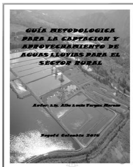
Figura 2. Portada de guía

El diseño de la propuesta presentada está basada en fundamentos teóricos de la GUÍA METODOLÓGICA PARA LA FORMULACIÓN DE PROYECTOS AMBIENTALES ESCOLARES un reto más allá de la escuela elaborada y aplicada por la Universidad Libre de Colombia y el Jardín Botánico José Celestino Mutis en el año 2004.