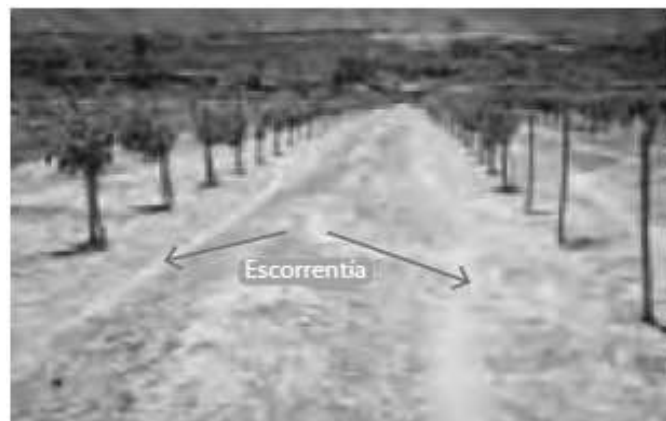
Figura 4. Sistema de captación para cultivos

La captación entre hileras o fajas de cultivos es la forma más simple de micro captación. Esta técnica consiste en separar las hileras del cultivo, de acuerdo a la relación obtenida. Para cada hilera de cultivo sembrada a contorno, se mantiene una franja de captación aguas arriba. Para mayor información diríjase a la guía de metodológica de captación y aprovechamiento de agua lluvias [12].