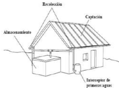
Figura 3. Sistema de captación de aguas lluvias por techos

“zonas urbanas los techos están contruidos de concreto, aleación de lámina galvanizada y antimonio; en las zonas periurbanas y rurales, de concreto, láminas de asbesto, lámina galvanizada, madera y paja; también se pueden utilizar las superficies impermeables (canchas, patios, estacionamientos), que no desprendan residuos o contaminantes al contacto con el agua e incrementen el costo del tratamiento para obtener un producto de calidad”. [21]