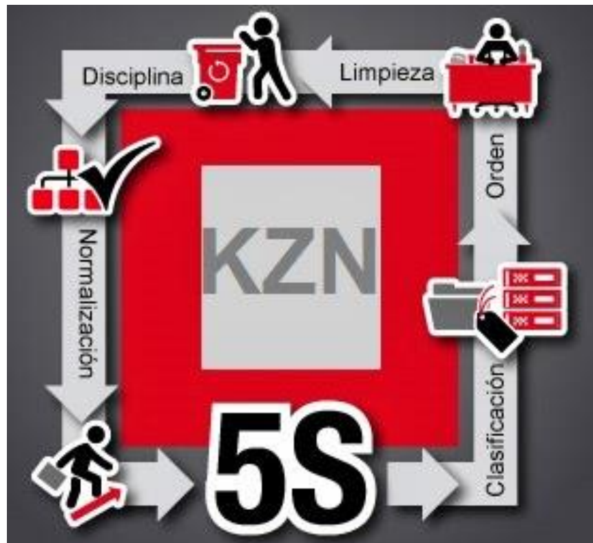
Figura 1: Grafica del proceso de la estrategia 5S.