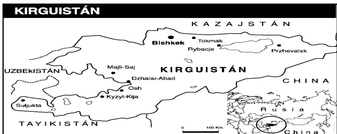
Mapa 1.6. Espacio Geográfico de Kirguistán