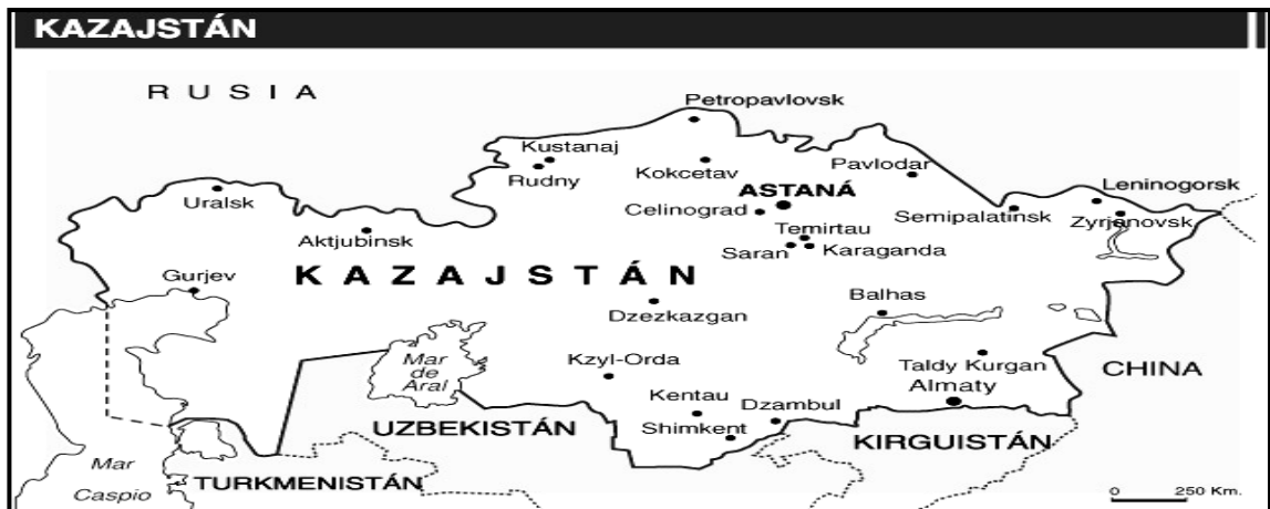
Mapa 1.2. Espacio Geográfico de Kazajstán