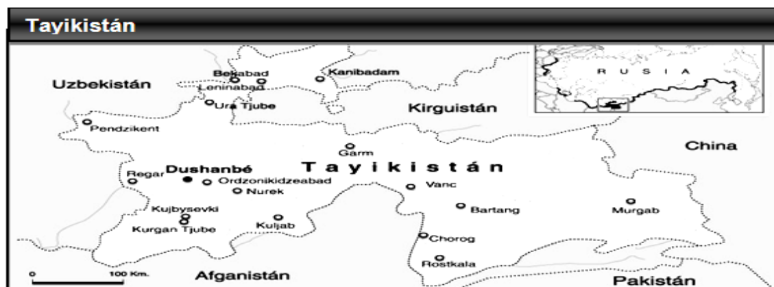
Mapa 1.5. Espacio Geográfico de Tayikistán