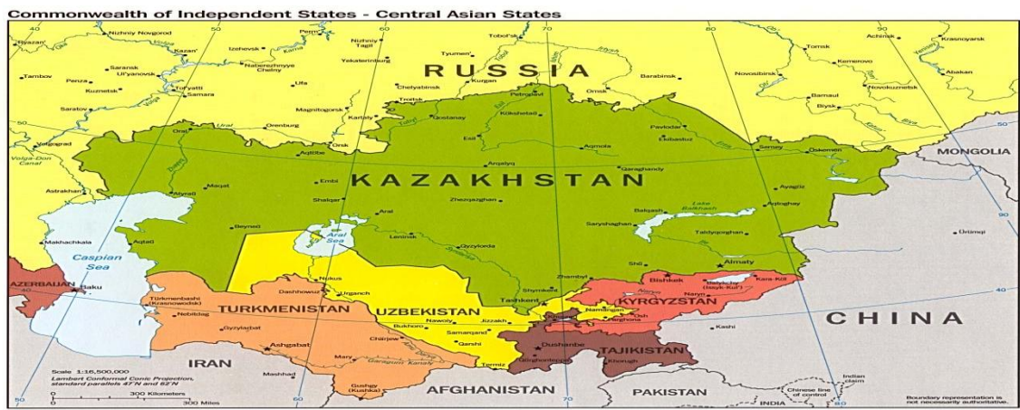
Mapa 1.1. Asia Central y su Área Colindante