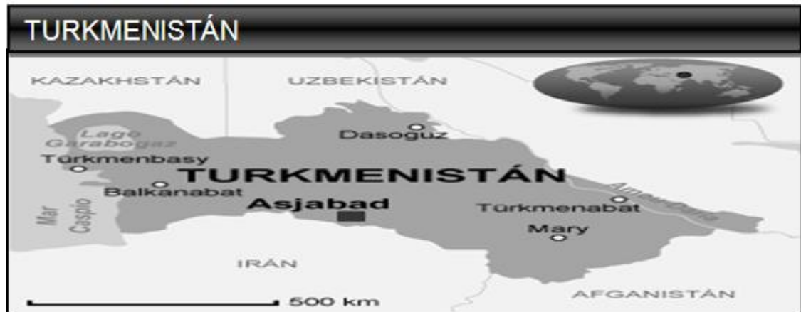
Mapa 1.3. Espacio Geográfico de Turkmenistán