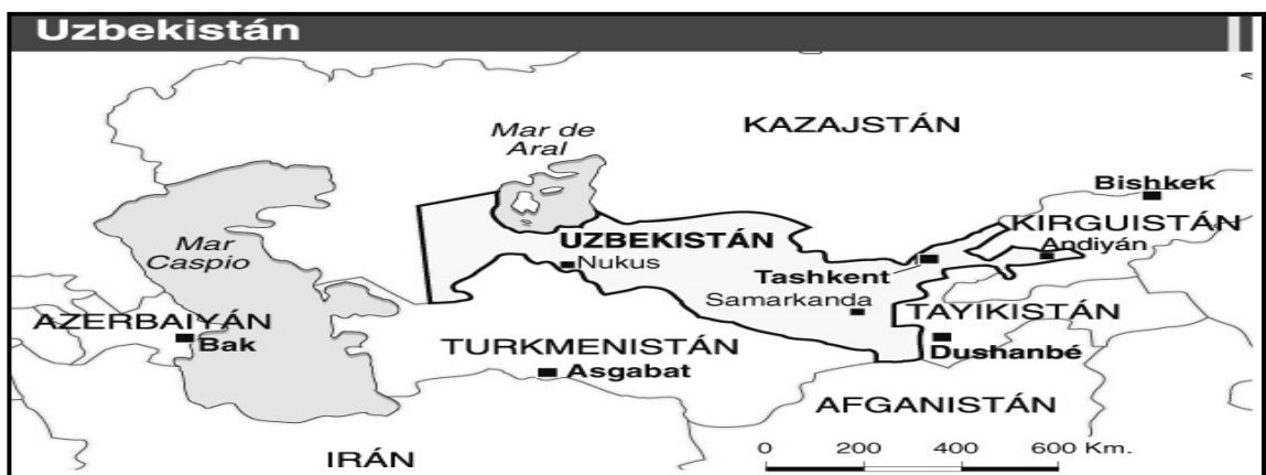
Mapa 1.4. Espacio Geográfico de Uzbekistán