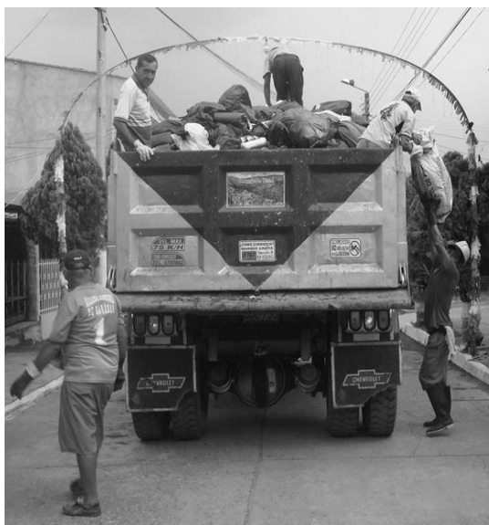
Figura 8. Recolección y transporte de los residuos

Por otra parte se puede ver la incomodidad y dificultad física para los operarios al momento de recolectar, se observó que unos de los operarios hace llamado verbal a la población para que saquen sus residuos.