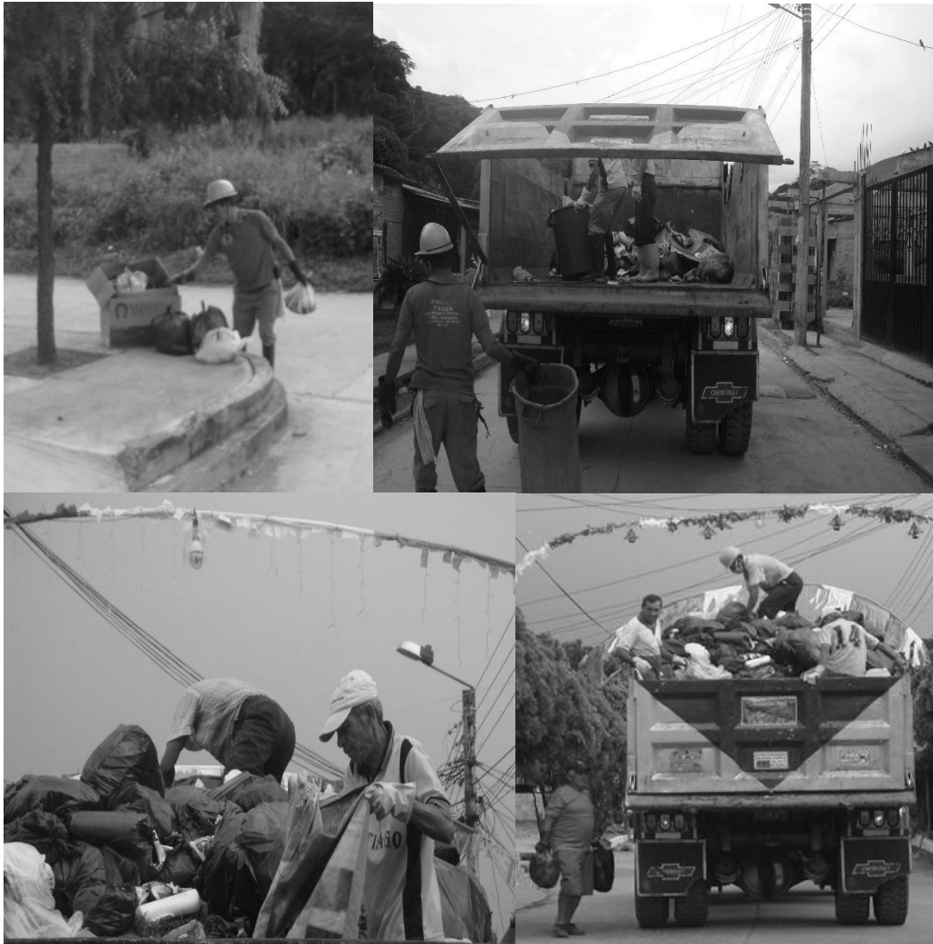
Figura 7. Personal encargado de la recolección.