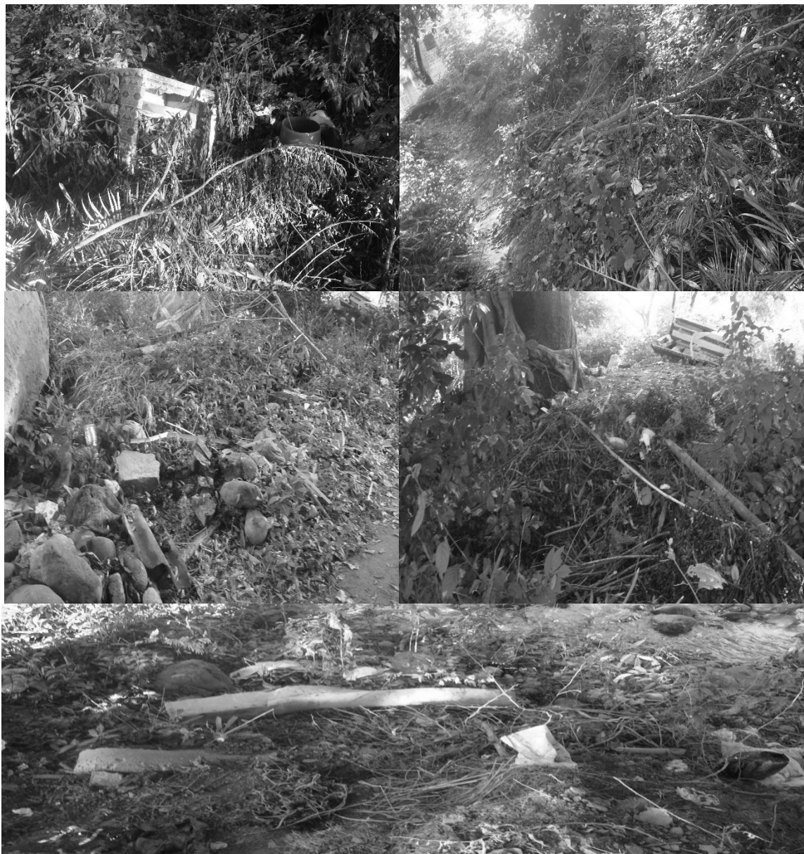
Figura 4.. Localización de focos de botaderos de basuras.

cerca de donde habitan o peor a un las botan en callejones o lotes, afectando el río Peralonso que en tiempos de lluvias estos residuos son arrastrados por las aguas hasta el cauce de esta fuente hídrica, y en casos extremos las basuras son botadas en las orillas de este recurso natural evidencia en la Figura 4.