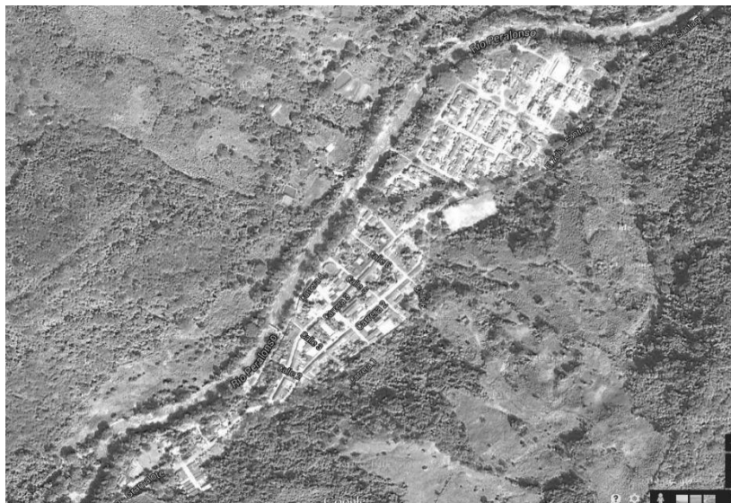
Figura 2. Ubicación Satelital del casco urbano de Santiago, Norte Santander

Localización: El Municipio de Santiago es una pequeña región de 173 km 2 , localizado en la parte central del departamento Norte de Santander. Su cabecera municipal dista de la ciudad de Cúcuta 33 kilómetros y Bogotá de 646 kilómetros. Su distribución geográfica es esencialmente montañosa y enclavada en la Cordillera Oriental. La posición astronómica del municipio de Santiago, según la latitud, está ubicado a los 7° 52' de latitud Norte. Según la longitud: es de 72° 43' de longitud al oeste de Greenwich. Por su extensión, el municipio de Santiago, equivale al 0.9% del total del Norte de Santander. Sus límites son al norte con los municipios de Gramalote y El Zulia; por el Sur con Salazar; por el Oriente con San Cayetano y Durania y por el Occidente con Gramalote [5].