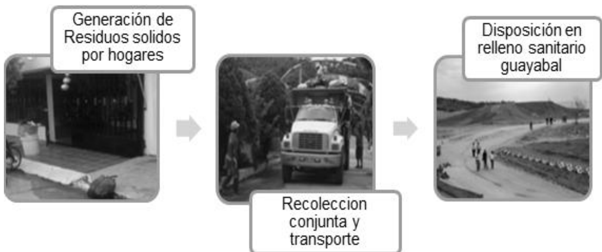
Figura 3. Dinámica de los residuos en el municipio de Santiago, Norte de Santander

El Municipio de Santiago no existen normas o protocolo que rijan la recolección de residuos, ni entidad Municipal que se apersona de esta problemática. Los habitantes recolectan los desperdicios en sus casas acumulándolos en las bolsa plástica donde venía empacado el artículo que había comprado para su hogar, algunas personas utilizan las bolsas de polietileno para recolectar basuras, otras utilizan el costal de fibra plástica donde se empaca el concentrado para los animales domésticos o donde trajeron el mercado, no existe una forma adecuada para la clasificación correcta de estas basuras, se hace en forma general sin discriminar los tipos de residuos, no existen grupos para el control comunitario del servicio.