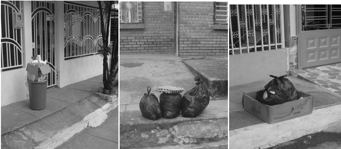
Figura 6. Presentación de los residuos.

La recolección de las basuras en el municipio de Santiago se realiza dos días a la semana, martes y sábado en horas de la mañana de 6:00 a 9:00 am. En estos días los habitantes sacan la basura en bolsas plásticas, costales o recipientes plásticos, cajas de cartón y las colocan frente a sus casas como se observa en la Figura 6, el vehículo utilizado para esta recolección es una volqueta, no existe una forma adecuada para la clasificación correcta de estas basuras, se hace en forma general sin discriminar los tipos de residuos.