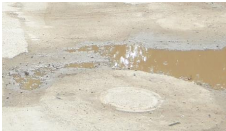
Imagen fisuras mapeadas