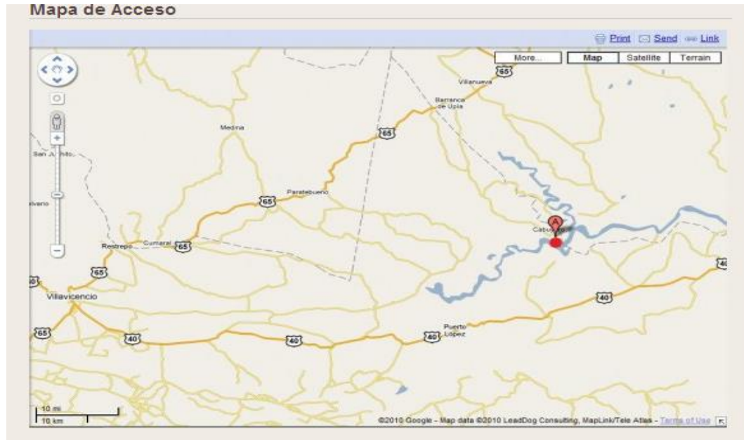
Imagen 1 localización geográfica del Municipio de Cabuyaro Meta tomado de pas google