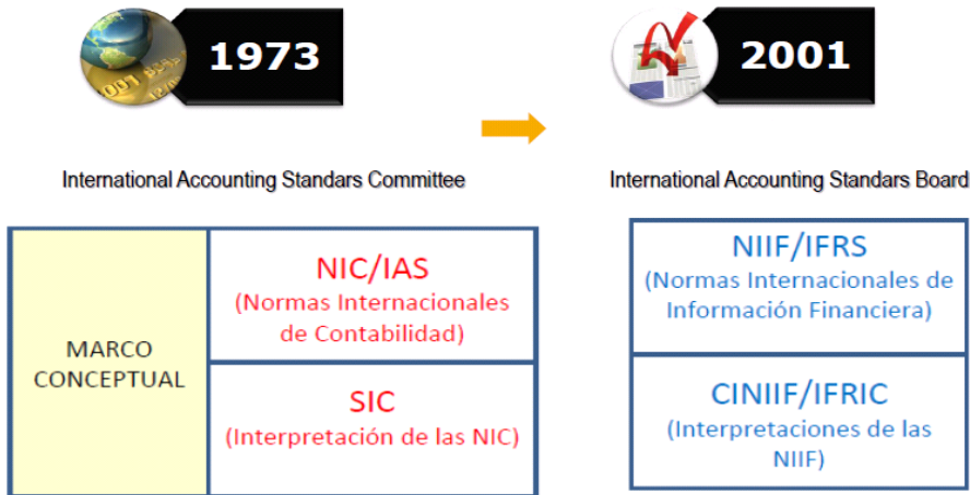
Figura 2 Organismos emisores de las NIIF