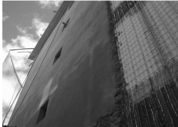
Grafica 6. Afinado y acabado final

Después de tener los muros con el mortero lanzado se realiza el afinado de los muros, un procedimiento manual en el cual se realiza el detalle para que la superficie de los muros quede completamente lisa sin imperfecciones, fisuras o rugosidades y así de esta manera se deja al muro listo solo para pintura.