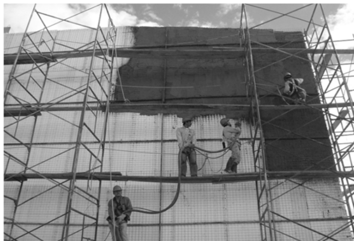
Grafica 5. Mortero lanzado.

Así de esta manera se aplica la mezcla del mortero a todos los paneles constructivos.